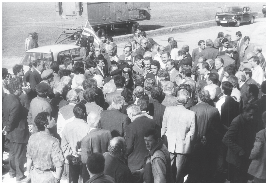
Адунеизегьтѳи апсуа-абаза жѳлар I-тѳи рконгресс. Лыхны 07.10.1992 ш.