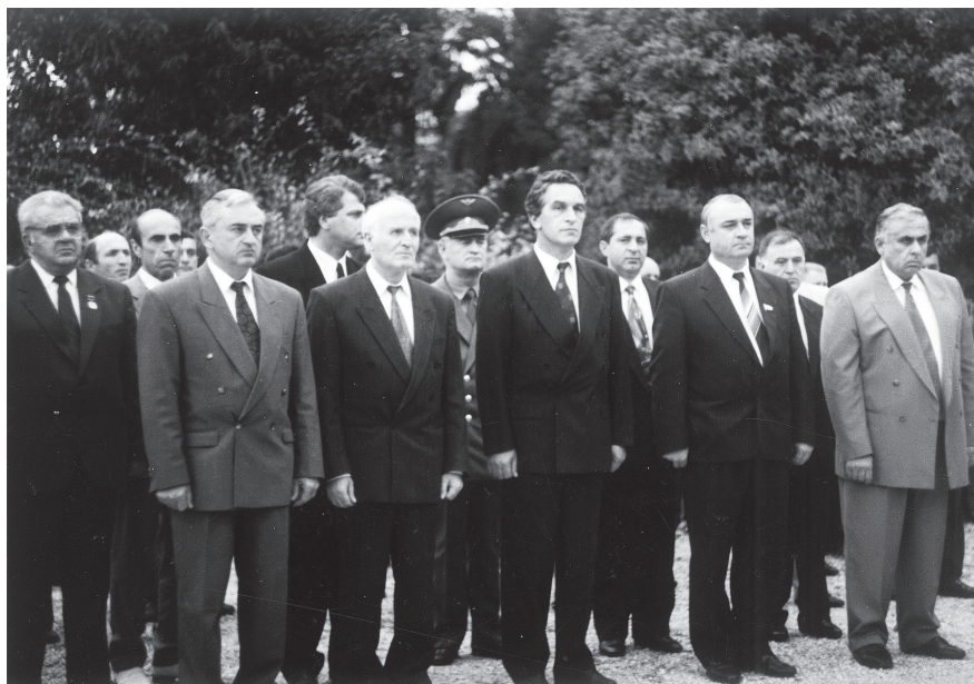
Ақәа, Ахьз-апша апарк ағы. 1997 ш.