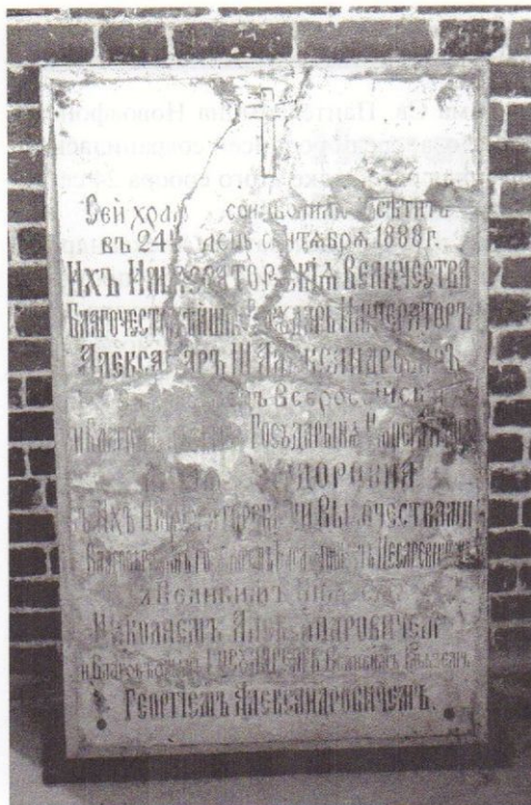
Рис. 1. Мемориальная доска конца XIX в., установленная в здании Покровской церкви в Новом Афоне в память о посещении российским императором Александром III и его семьей названной церкви 24 сентября 1888 г. (Фонд Церковно-археологического музея СМА)