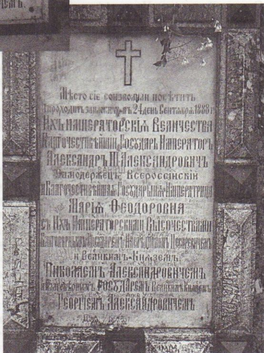
Рис. 2. Мемориальная доска конца XIX в., установленная на отвесной скале, справа от верхней арки лестничного подъема на плотину (водопад) в Новом Афоне, в память о посещении российским императором Александром III и его семьей названной церкви 24 сентября 1888 г.