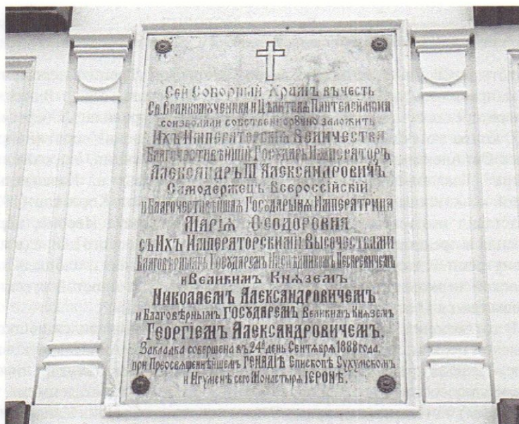
Рис. 3. Мемориальная доска конца XIX в., установленная на западном фасаде соборного храма Св. Пантелеимона Новоафонского монастыря в память о закладке данного собора 24 сентября 1888 г. при участии императора Александра III