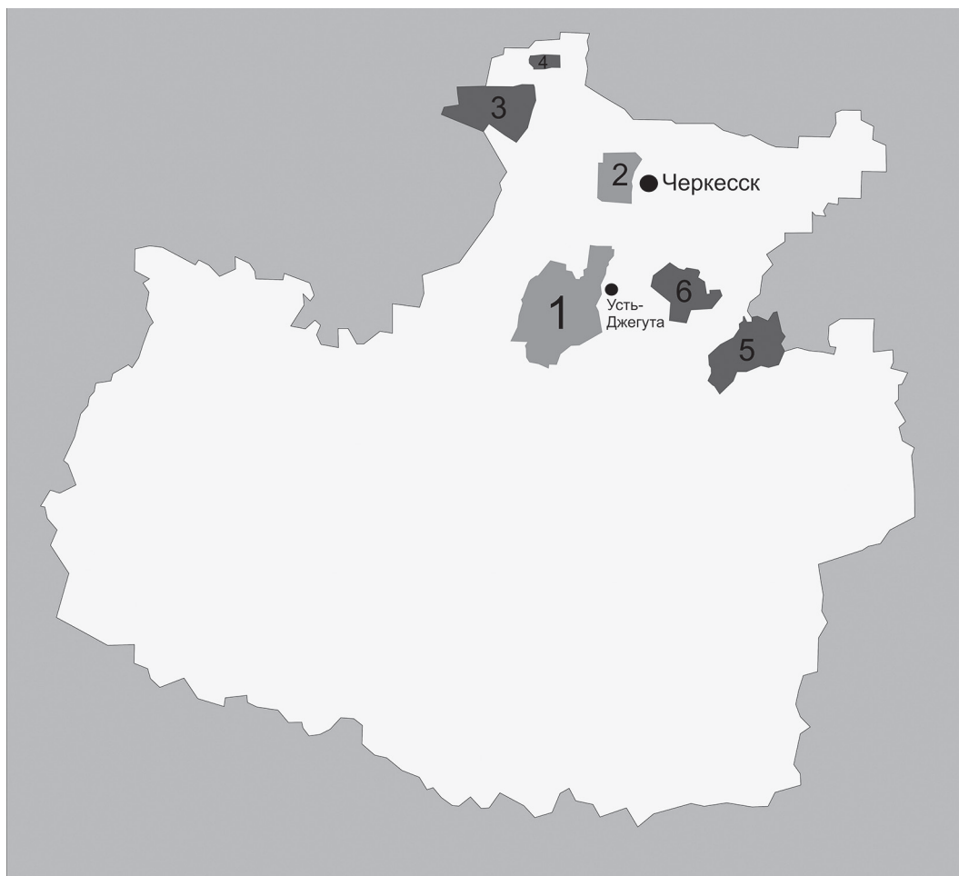
Рис. 2. Картосхема ареалов абазинской этнической территории в КЧР.

6. Тапантский аул Койдан Усть-Джегутинского района, в настоящее время имеющий смешанное абазино-карачаевское население.