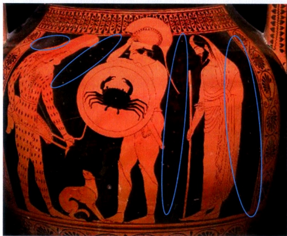
Рис. 3. Аттическая к-ф амфора из Вульчи, приписывается Дикайосу. Лондон, Британский музей E255. Ок. 510–500 гг. до н. э.

На другой краснофигурной аттической амфоре 510–500 гг. до н. э. изображены воин с собакой, мужчина в длинном хитоне и мужчина в восточной одежде (рис. 3). Фигуры сопровождаются четырьмя надписями (слева на право): ΚΙΣΙ ( кизи ), ΓΕΧΓΟΓΧ ( гехгогх ), ΧΕΧΓΙΟΧΕΧΟΓΕ ( хехгиохехоге ), ΧΛΕΙΟΠΧΙΟ ( хлейопхио ). Из четырех, три выражения представляют общечеркесский язык. ΚΙΣΙ переводится как «вот его друг», ΧΕΧΓΙΟΧΕΧΟΓΕ как «из храбрых избранный» и ΧΛΕΙΟΠΧΙΟ как «потомок дочери большого человека». Второе слева выражение ΓΕΧΓΟΓΧ переводится с абхазского языка как «храбрый противник» [Mayor, Colarusso и Saunders 2014, pp. 481–483].