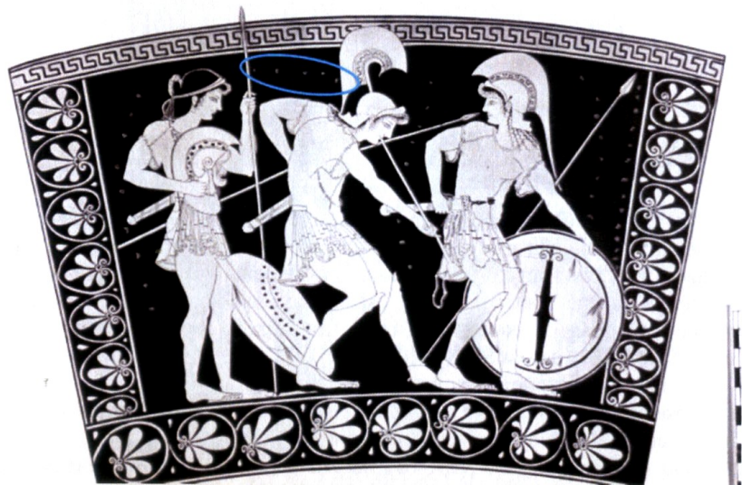
Рис. 5. К-ф аттическая гидрия из Вульчи, так наз. Nupsis vase (ваза Гипса). Мюнхен 2423, 510–500 гг. до н. э. [Mayor, Colarusso и Saunders, 2012, fig. 3]