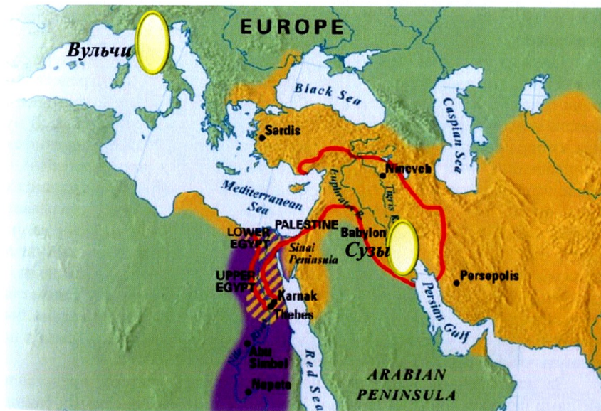
Рис. 6. Карта распространения подобных ваз. (По карте Teacher Websites 2015 Blackboard: 4.0 Ancient Empires, 700 В. С. – 221 В. С.)

Другие надписи, изученные указанной группой лингвистов, передают речь на абхазском, убыхском и грузинском языках. Надписи всегда сопровождают фигуры, т. е. не даны отдельно.