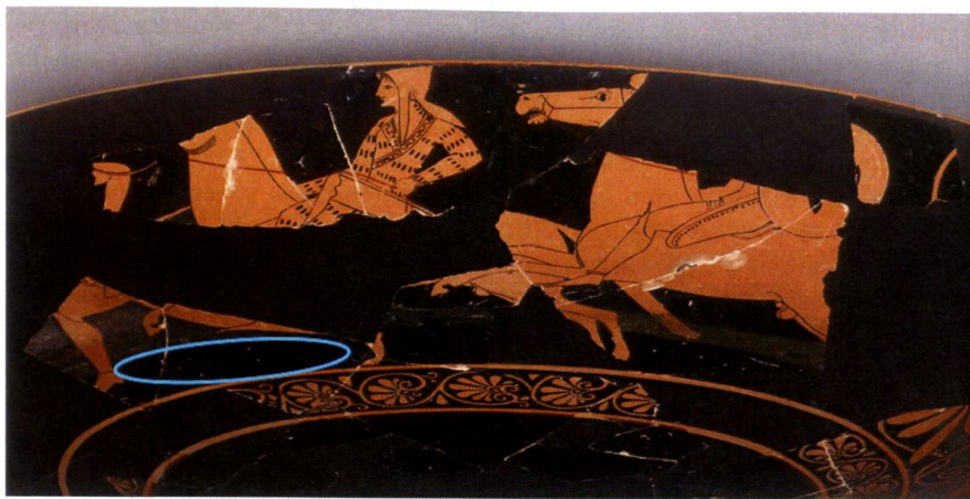
Рис. 4. Аттическая к-ф чаша, приписывается Олтосу. Малибу, Музей Гетти, Villa Collection 79. АЕ. 16. 525–500 до н. э.