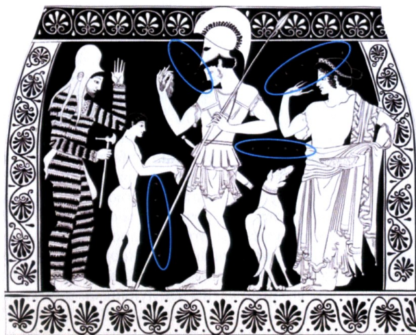
Рис. 2. Аттическая к-ф амфора из Вулчи, приписывается мастеру Клеофадра. Вюрцбург музей L 507. 510–500 гг. до н. э. [Mayor, Colarusso и Saunders, 2014, fig. 4]