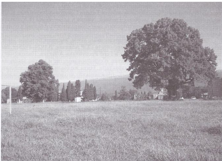
Поляна в с. Лыхны – историческое место всенародных сходов абхазов Республика Абхазия, Гудаутский район. Фото Л.Т. Соловьевой, 2005 г.

Н.А. Лакоба был захоронен в Сухуме со всеми советскими почестями. Неординарный лидер, выходец из народа, простой и доступный, он пользовался огромной популярностью в Абхазии. При нем Абхазия не спешила с организацией колхозов, чем абхазский лидер заслужил критику И.В. Сталина, крестьянство не знало ужасов раскулачивания, которое свирепствовало в соседних республиках, а старые абхазские аристократы спокойно доживали свой век, без боязни быть арестованными и сосланными в Сибирь. На его похороны пришли тысячи граждан, было много телеграмм от советских и зарубежных коммунистов. Знаменательно, что Л.П. Берия на похороны не приехал. Несколько месяцев спустя, в начале 1937 г., в прессе прошла сенсационная новость, что в Абхазии раскрыт антиправительственный заговор, ставящий целью “убийство великого Вождя мирового пролетариата И.В. Сталина и лидера грузинских коммунистов Л.П. Берия”. Во главе заговора, как сообщалось, был “обер-бандит Лакоба”. Лакоба был посмертно объявлен “врагом народа”, и его могила была уничтожена. В Абхазии началась вакханалия террора.