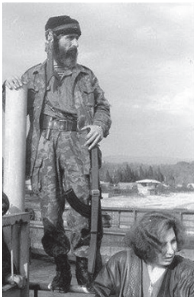
Руслан Кәулаа Аңсны афырхаҗа, агәың «Шьаратын» аиҳабы