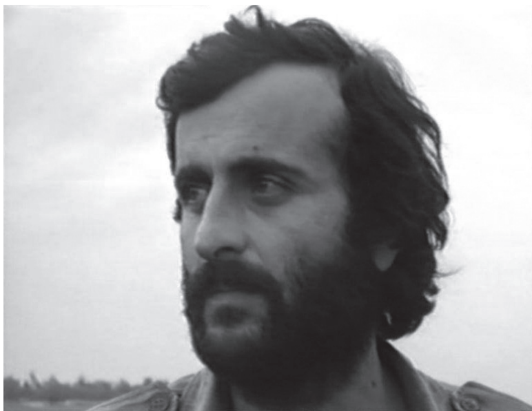
Гогли Гогэуа агэымышэаразы амедал занашьоу