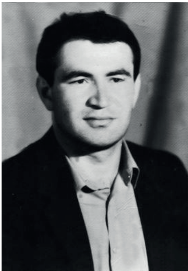
Лаша Козониа Леон иорден занашьоу