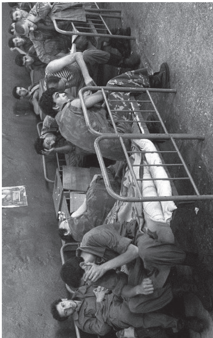
Ақыртүра қыбылауаца иртікөаз гәыңоык аңсуа еибашыңа: Баҗал Хьаца, Реваз Апишың-ба, Баҗал Аөзба, Сергеи Ариба, Лаша Қоғоша, Аслан Каца, Иракли Шәқъариа