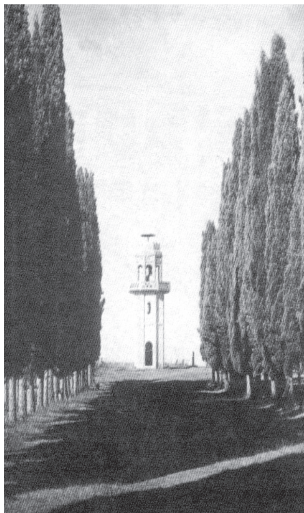
Рис. 7. Маяк Н.Н. Смецкого на набережной Агудзеры.

Так, в путеводителе по Кавказу за 1910 год писали: «В 1902 г. в 12 верстах от Сухума открыт грандиозный санаторий Смецкого «Гульрипш». Это в высшей степени симпатичное учреждение сооружено на средства и на земле г. Смецкого, поставившего себе задачу прийти на помощь