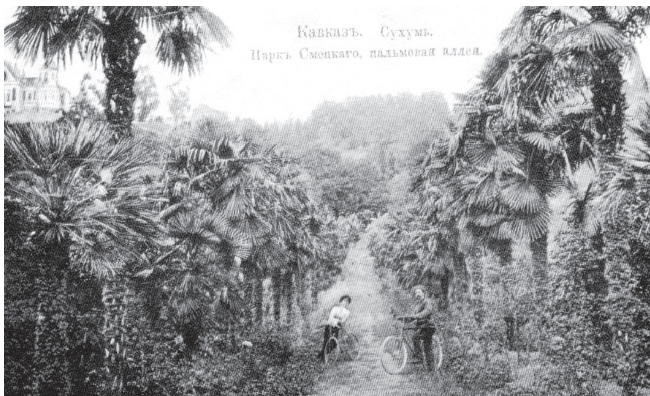
Рис. 2. Парк Смецкого, пальмовая аллея (Сухум).

ного попутчика-студента на этом корабле настолько впечатлил чету, что Смецкие не сошли в Сочи, а купили билеты до Сухума и уже там сошли на берег (Агумаа А.С., 2010, с.26). Как оказалось впоследствии, эта остановка в Сухуме стала судьбоносной, для Абхазии, благодаря неизвестному студенту, приобретшая себе будущего мецената края — Н.Н. Смецкого.