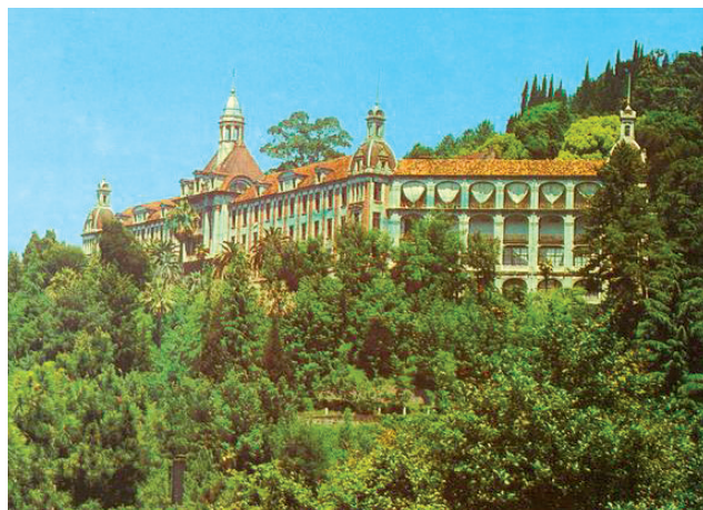
Рис. 4. Санаторий Н.Н. Смецкого «Гульрипш» (красное здание).

(Агумаа А.С., 2010, с. 68, рис. 3). Корпус предназначался для туберкулезных больных. Это был первый санаторий на Кавказском Причерноморье. По своим масштабам еще более величавый. Комиссия из России, которая приехала для того, чтобы осмотреть это здание, была настолько потрясена, что назвали санаторий Дворцом гигиены. Это был один из лучших санаториев в Европе. По своей архитектуре санаторий «Гульрипш-1» скорее близок к стилю неоклассики с элементами неорусского направления. С особой тщательностью строители подошли к расположению