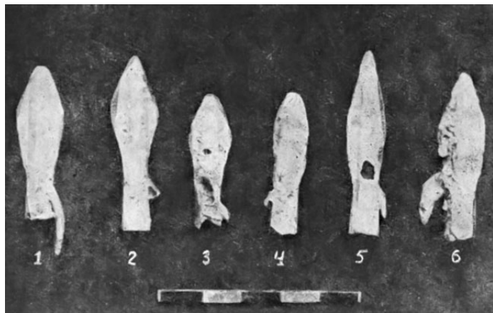
Рис. 1. Основные типы бронзовых втульчатых двухпёрых наконечников стрел (Куланурхуа)

ранение. Эти стрелы невозможно вынуть из раны, а медная окись рано или поздно приводила к смерти даже при лёгком ранении (Бгажба, Лакоба 2007, 51). Такие наконечники скифского типа были найдены на могильнике с. Куланурхуа. Это были бронзовые втульчатые наконечники стрел овальной формы с шипом на втулке. Всего на этом могильнике было выявлено до девятнадцати наконечников стрел данного типа раннескифского времени (Трапш 1970, 132). Такие же бронзовые двухлопастные втульчатые с овальной ромбической головкой и шипом на втулке наконечники встречаются в курганах Восточного Приазовья (Шевченко 2014, 265). Аналогично на Красномаяцком могильнике (Сухум) также был обнаружен бронзовый втульчатый наконечник стрелы скифского типа в погребении № 82. Он трёхпёрый, овальной формы (Трапш 1969, 181). Наконечники стрел, сходные с красномаяцким, происходят из грунтовых погребений Самтаврского могильника (Мцхета) (Абрамишвили 1957, 140). Несомненно, наконечники стрел отмеченного типа, встречаемые в комплексах VII–VI вв. до н. э. имели широкое распространение на территории Кавказа и Переднего Востока.