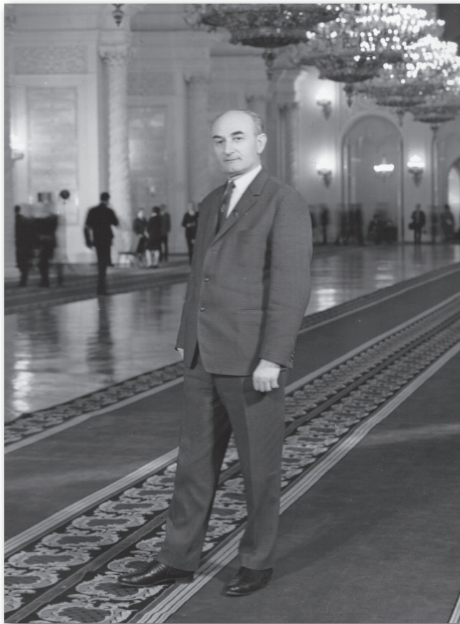
Гьаргь Зизариа -1957 – 1967 ши. раан Аќэатэи ахэын- тќарратэ рцафратэ институт ректорс иќаз, Аќсны атќоурых иазкны раћхьаза афилологиа тэ факультет акны алекциаќэа ирыћхьоз