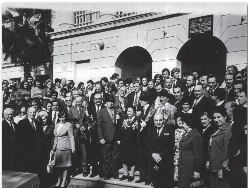
Дыркэтэылантэи хыбынцьхылцьиьтрақэа раңхьа Аңсны ианааз Акэатэи арцафратэ институт акны иҥыхьу афотосахьа. 1975 и.