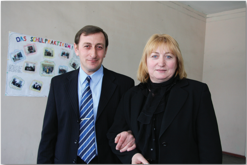
Афилологиятә факультет адекан инапынцақда назыгзо Арда Ашәбеи арцааы еихабы Манана Шьоууеи