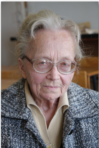
Академик Маргарита Ладарина