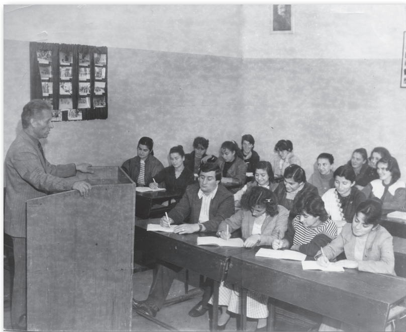
Афилологитэ тѣарадыррақэа рдоктор, академик Шоѣа Арѣаа алекѣиақэа данрыѣхьо аамѣазы