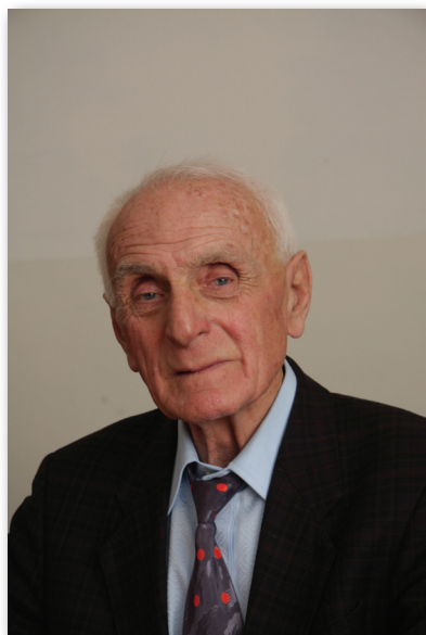
Ашэкэыооы, ацарауао, арцаоы Гьаргь Гэыблиа