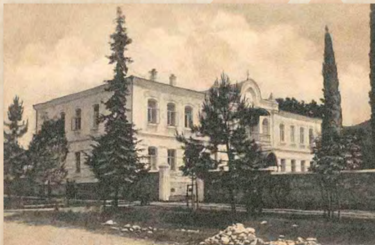
Дом епископа в Сухуме