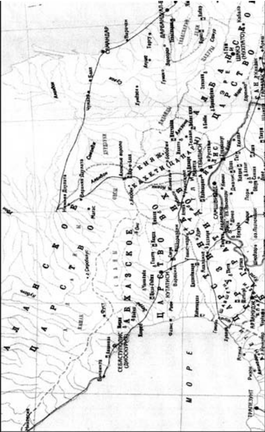
Линия Тайк–Кларджкских Багратидов (Куропалатов)

Автор карты С. Т. Еремян. Карту оформил и подготовил к печати П. К. Погосян. Ереван. 1983 г.