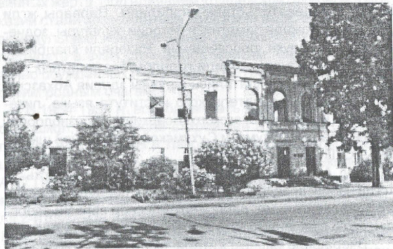
Разрушенное здание школы.

зии, которая продолжалась долгие годы, усугубляя и без того, тяжелую поствоенную жизнь нашего Отечества. Мало того к экономической блокаде присовокупилась и информационная! Но героический абхазский народ с присущими ему терпением и достоинством выдержал и это испытание.