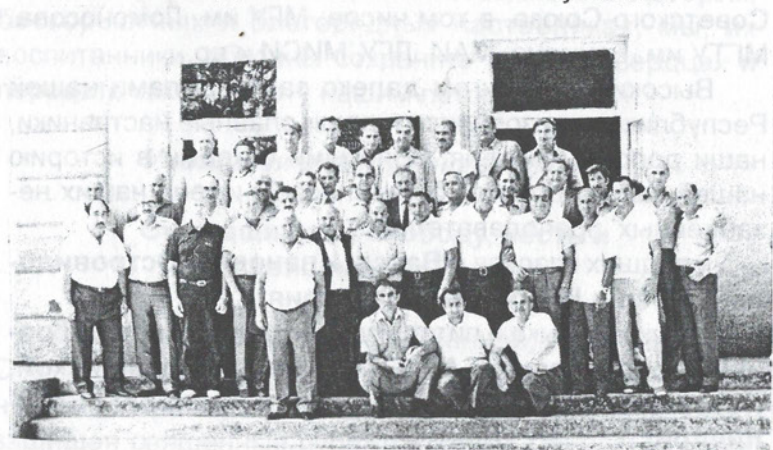
Выпускники школы 1954 г.

Благодаря этой помощи Абхазия смогла широким фронтом развернуть работы по восстановлению жилых домов, школ, спортивных сооружений, дорог, сетей и сооружений электроосвещения, водопровода и других инженерных коммуникаций. К числу восстановленных за счет выделенных Россией средств относится и наша Сухумская 2-я русская школа им. А.С. Пушкина.