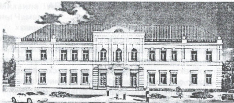
Здание после восстановления.

В ожидании лучших времен, несмотря на разруху и опираясь на собственные людские и природные ресурсы, страна, хоть и медленно, продвигалась к решению важнейшей задачи дня – восстановления разрушенного войной народнохозяйственного комплекса и продовольственного обеспечения населения, не теряя при этом веры и надежды на помощь дружеских стран и братских народов. И не ошиблась. Положение резко изменилось после избрания Президентом Российской Федерации Владимира Владимировича Путина. Именно с приходом этого выдающегося политического и государственного деятеля Абхазия впервые за долгие годы ощутила сочувствие и братскую помощь со стороны