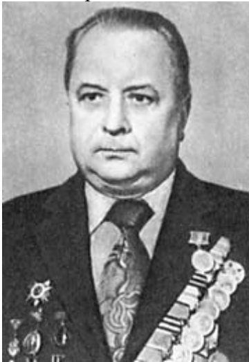
А. Г. Жуков: