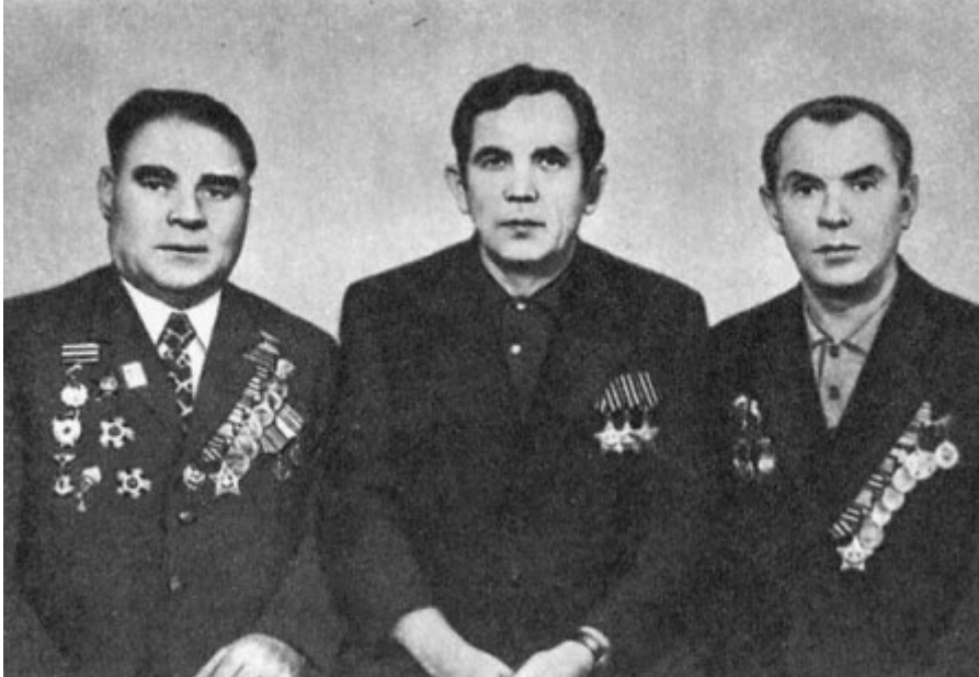
Вечная слава павшим: