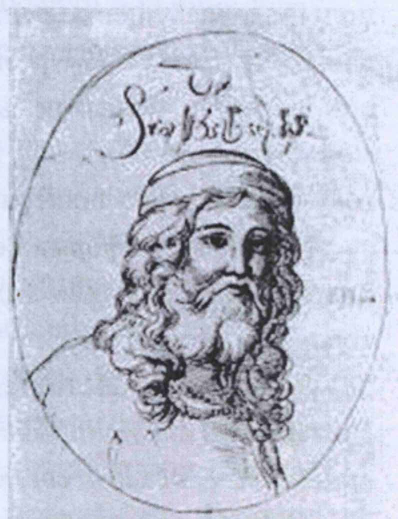
Рисунок Дона Кристофора де Каstellи.