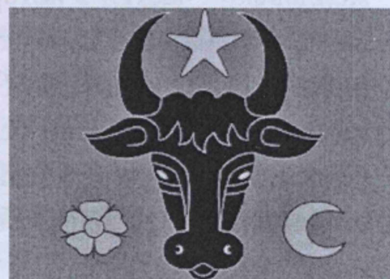
Герб Молдавского княжества.