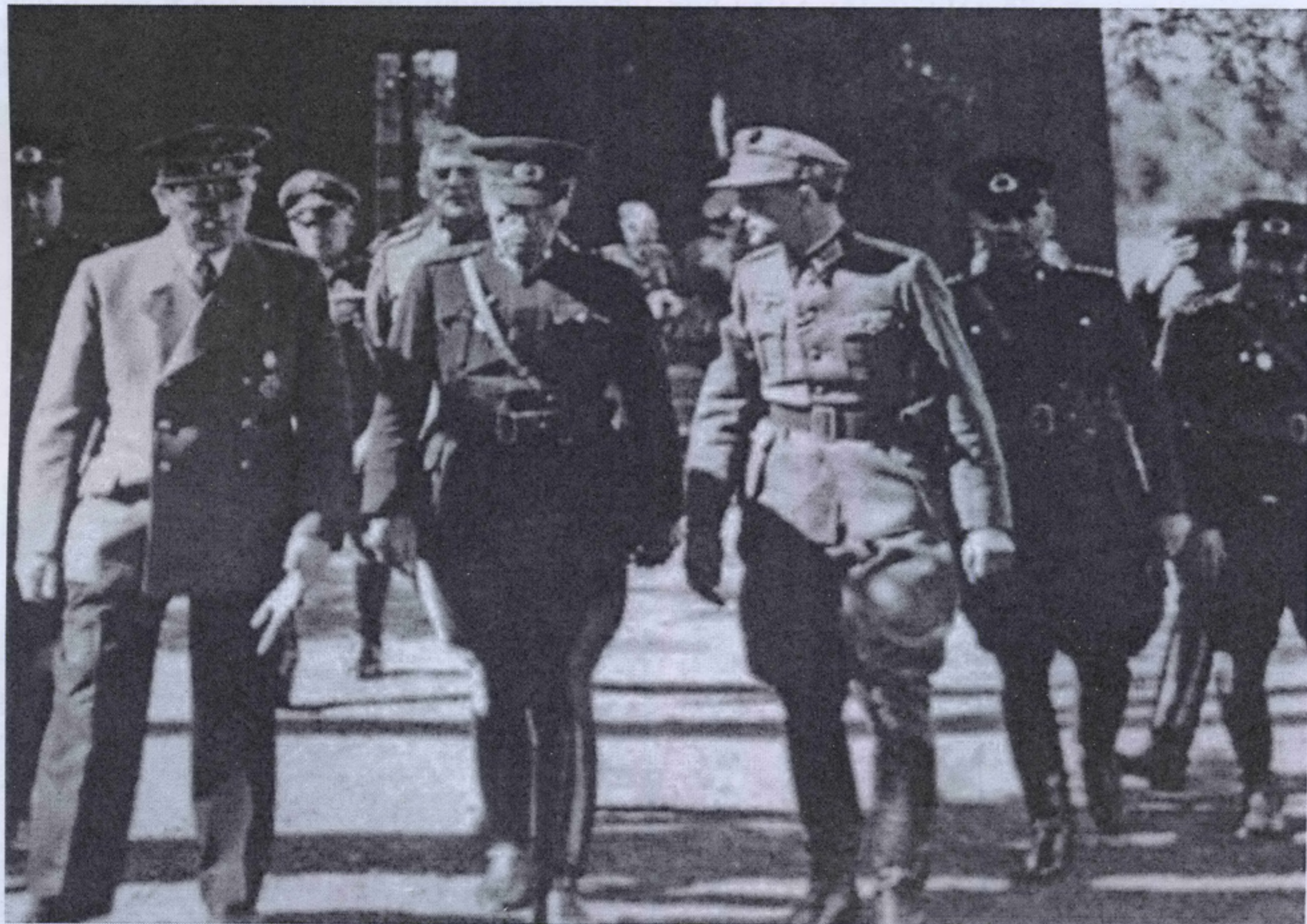
На фото слева направо: Адольф Гитлер, Джемиль Джахит Тойдемир, Вильгельм Кейтель.

Чтобы усилить впечатление от манёвров танковых дивизий на Восточном фронте, турецкую делегацию пригласили на побережье Ла-Манша осмотреть сильно укрепленные пункты Атлантического вала [3].