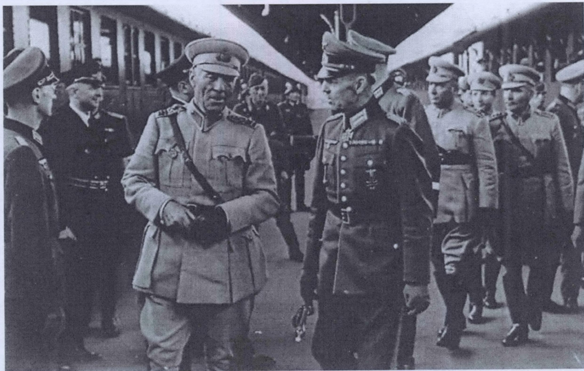
Генерал Джемил Джахит Тойдемир и Фельдмаршал Герд фон Рундштедт.

К концу августа советское командование оказалось в очень неловкой ситуации, когда восемь армий Северо-Кавказского фронта, развернутые фронтом на север, противостояли грабежу и опустошению, которое несли немцы, а всего лишь в 120-130 км к югу от них Закавказский фронт разворачивал свои пять армий для защиты от ожидаемого нападения Турции [2]. Сочи при такой ситуации находился, как и всё Черноморское побережье в очень опасном положении. Незадолго до Сталинградской битвы