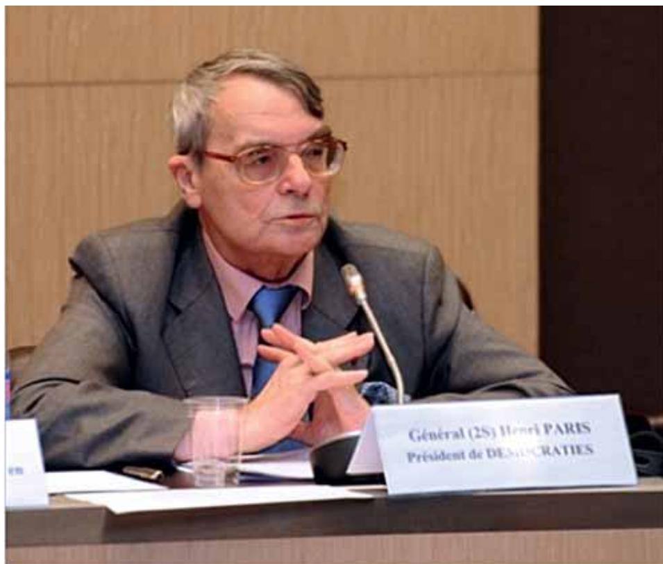
Выступает Анри Парис (Франция)

верительные отношения с мусульманскими государствами, — заявил французский специалист.