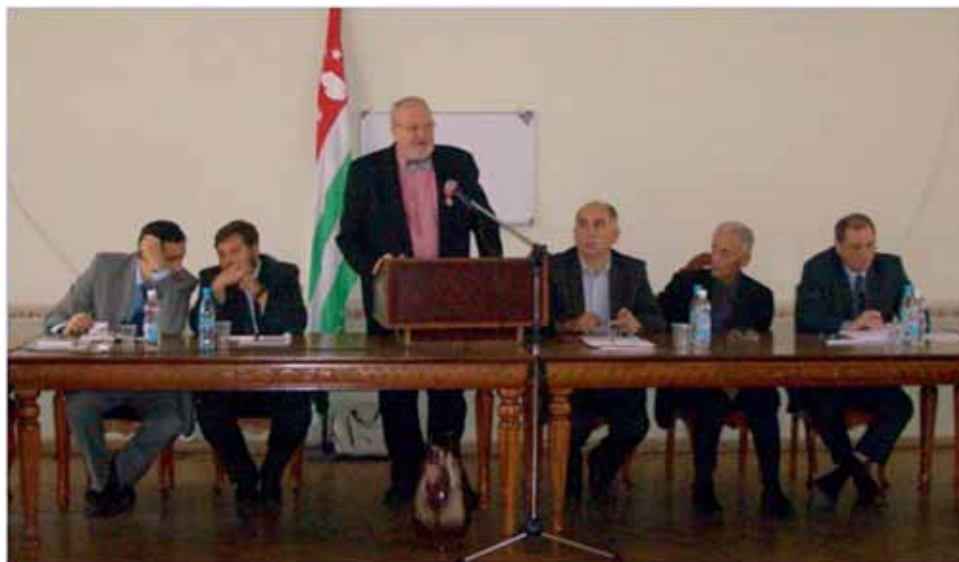
Выступает В.А. Захаров (Россия)

няла решение вступить в члены НОК. Было достигнуто общее согласие и о возможности для абхазских ученых одновременного членства в обеих организациях.