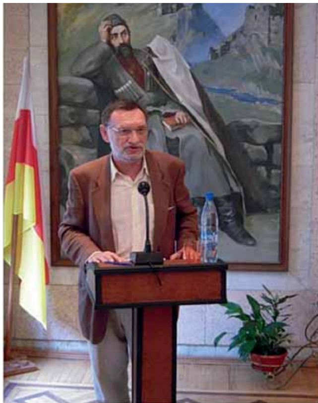
Выступает Ивлиан Хаиндрава (Грузия)

на взаимовыгодной основе шаг за шагом решить те вопросы, которые подлежат решению уже сегодня. Это безопасность, экологические, экономические проблемы, вопросы, связанные с перемещением людей и многое другое».