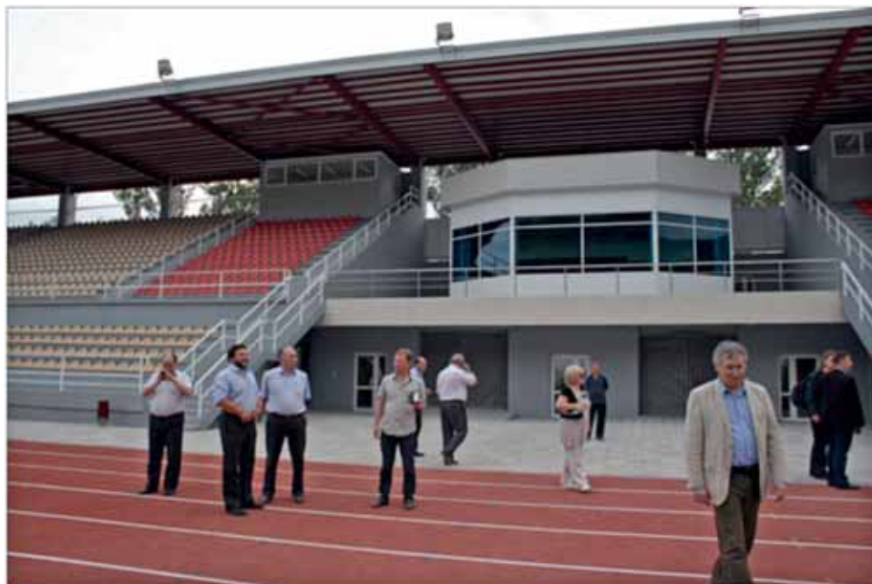
Осмотр новостроек в Цхинвале