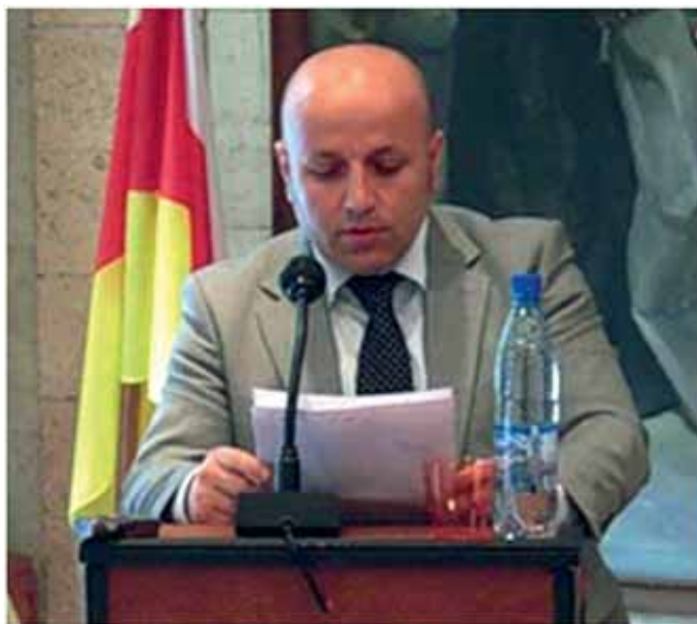
Выступает Алескер Алескерли (Турция)

ми вызовами. Бурные события в странах Ближнего и Среднего Востока актуализировали поиск адекватных сценарных моделей развития и модернизации.