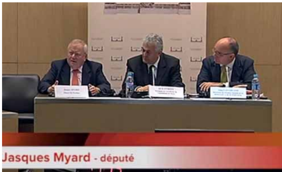
Выступает депутат Парламента Франции Жак Мейяр

ской Северной Кавказ, однако создала внушительную пропасть между Россией и Южным Кавказом.