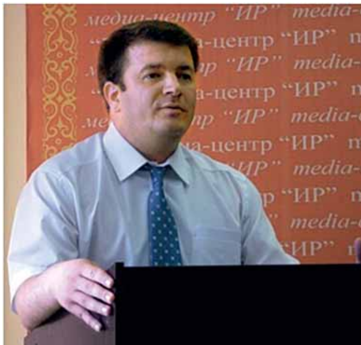
Выступает Д.Г. Санакоев (Южная Осетия)