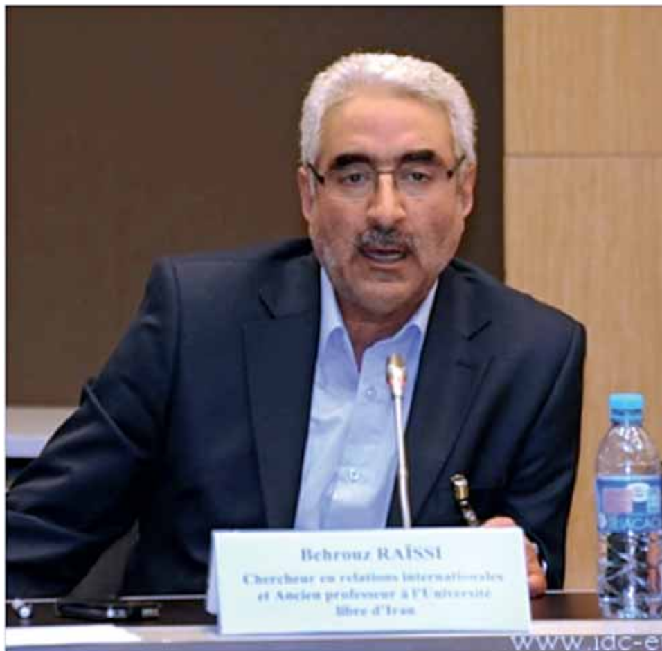
Выступает Б. Раиси (Иран)

сближения России и Ирана, убежден иранский эксперт, так как перед этими странами были поставлены общие вызовы: не допустить оксидентализации 1 Грузии и расширения блока НАТО на Кавказ.