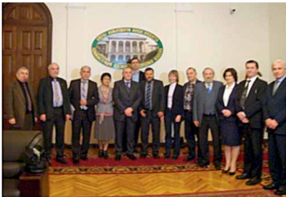
Президент Абхазии А.З. Анкваб и участники семинара

Принято единогласно в г. Сухум, 29 ноября 2012 г.