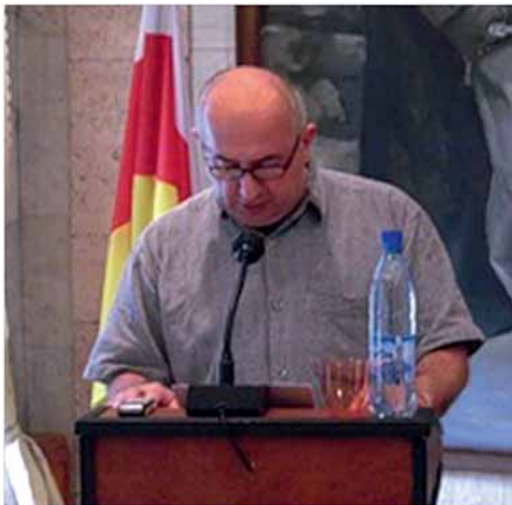
Выступает Паата Закареишвили (Грузия)

Другой представитель Грузии, директор Института исследований национализма и конфликтов Паата Закареишвили (Тбилиси) рассказал о северо-