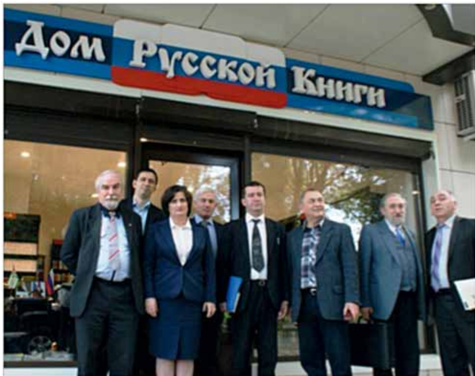
Посещение сухумского Дома Русской книги