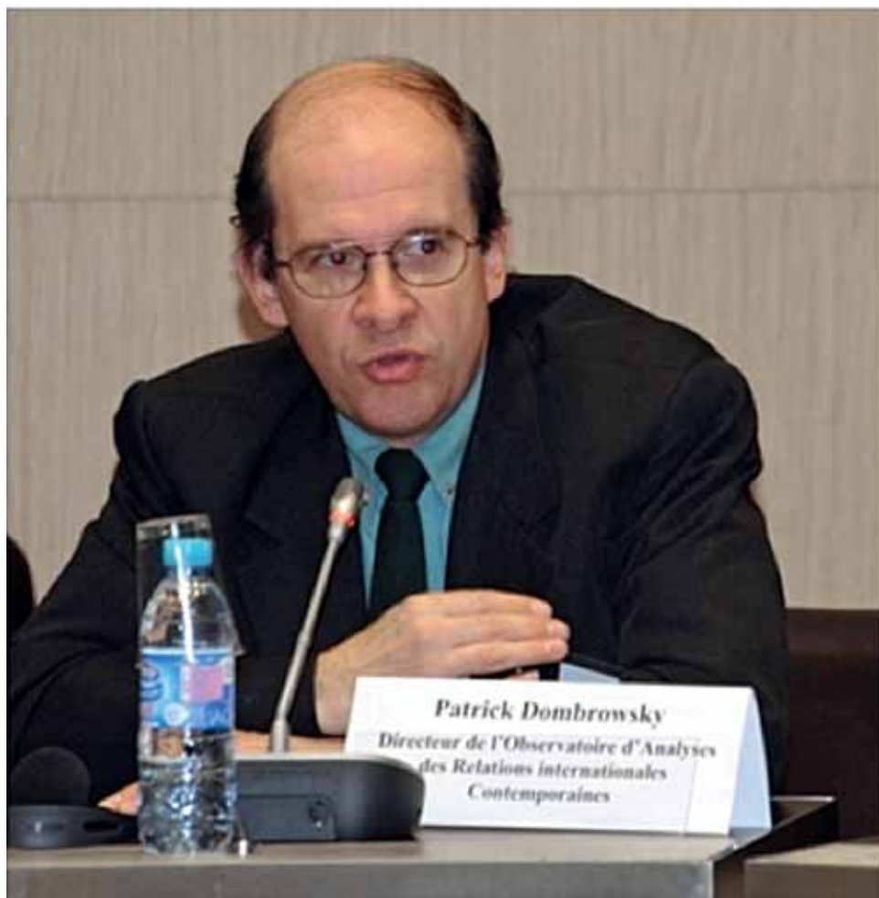
Выступает Патрик Домбровски (Франция)

П. Домбровски, директор французского Центра наблюдений и анализа современных международных отношений (Observatoire d'Analyses des Relations internationales Contemporaines), представил альтернативный «двухосевой модели» подход к пониманию Кавказского региона. Французский докладчик предложил аудитории взглянуть на Кавказ как на стратегический плацдарм между Черным и Каспийским морями. С высот Кавказского хребта очень удобно оказывать влияние на Черноморский и Каспийский регионы.