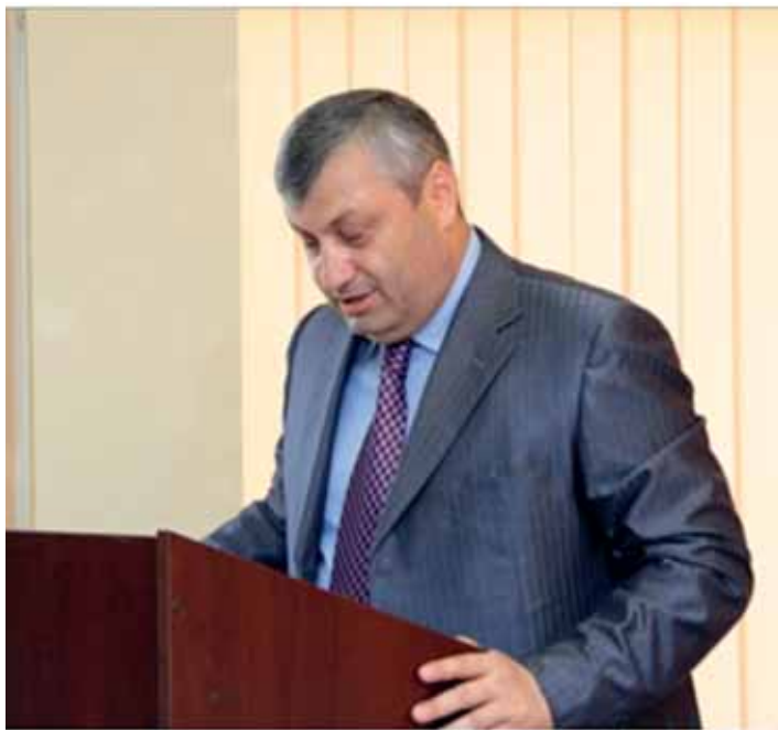
Выступает президент Республики Южная Осетия Э.Д. Кокойты

ношений отвечает интересам двух государств, способствовала бы стабилизации ситуации в масштабах всего Кавказа. На конференции были проанализированы угрозы миру и безопасности в регионе, препятствующие его успешному социально-экономическому развитию.