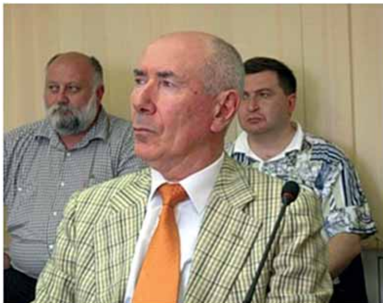
Посол РФ в Южной Осетии Э.К. Каргиев