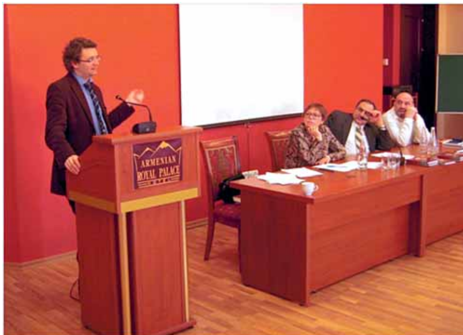
Выступает Джеймс Никси (Великобритания)

ности, предпосылки мирного решения конфликтов, исторические связи народов Кавказа с Россией, Западной и Восточной Европой, Турцией, Ираном и другими странами.