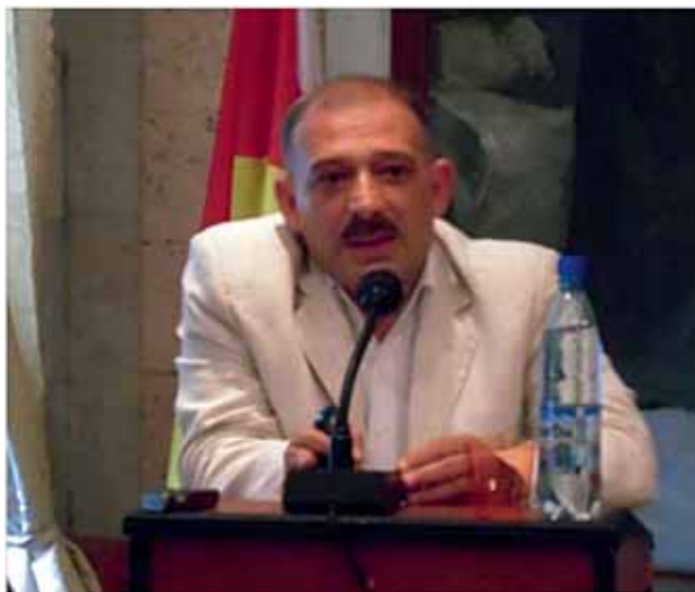
Выступает Рауф Миркадыров (Азербайджан)

кавказской политике Грузии, ее возможных последствиях для двусторонних отношений и для региона в целом. По его мнению, Северный Кавказ создает серьезные вызовы российской государственности, но он потенциально способен стать точкой сближения двух стран. При содействии ЕС и ОБСЕ можно достичь позитивного вклада Грузии в обеспечение региональной стабильности, что подразумевает и переформатирование некоторых шагов официального Тбилиси на северокавказском направлении.