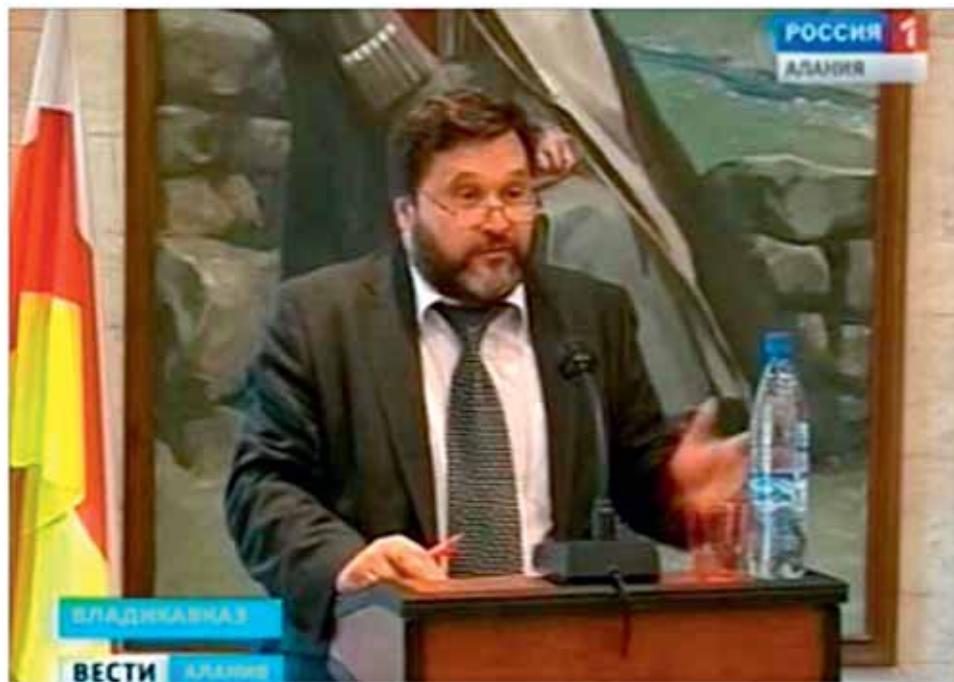
ТВ репортаж о конференции

После Пятидневной войны США и ЕС лишились изрядной доли своих иллюзий по поводу грузинской демократии, прозвучало много довольно жестких критических замечаний в адрес правящего режима. Но затем политика Тбилиси вновь получила существенную моральную поддержку: Сенат США единогласно принял резолюцию «о продолжающихся нарушениях суверенитета и территориальной целостности Грузии и отношении к мирному урегулированию конфликта в рамках международно признанных границ Грузии». В документе, в частности, говорилось, что «Абхазия и Южная Осетия — это регионы Грузии, оккупированные Российской Федерацией». Сенат США призывал Россию предпринять шаги для выполнения всех положений соглашения о прекращении огня от 2008 г., т.е. «вывести войска из Абхазии и Южной Осетии и обеспечить до-