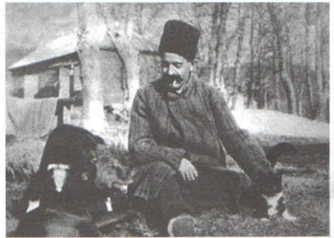
Гурджиев на Кавказе

Авторы фильма «Сталин, Гитлер и Гурджиев» утверждают, что оба диктатора были его учениками. Это громкое заявление, является, конечно, фальсификацией, желанием привлечь зрителей сенсацией, хотя определенное влияние, по-видимому, имело место. Так по свидетельству учеников Гурджиева, в его книге «Встречи с выдающимися людьми» была уничтоженная, в последствии глава «Князь Нижарадзе» - это один из псевдонимов Сталина. Они оба, вместе учились в семинарии в Тифлисе, молодой Джугашвили жил одно время на квартире у Гурджиева и, как утверждают некоторые авторы, стал его «духовным учеником». Но полностью