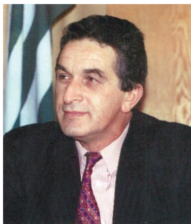
Председатель Верховного Совета РА В.Г. Ардзинба