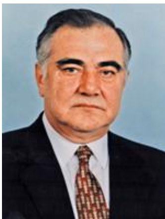
Президент КБР В.М. Коков

Пути отправки северокавказских добровольцев в Абхазию в 1992-1993 гг.