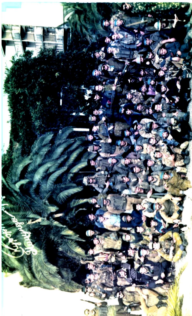
Кабардинские добровольцы в Пицунде перед Шропской наступательной операцией. Ноябрь 1992 г.