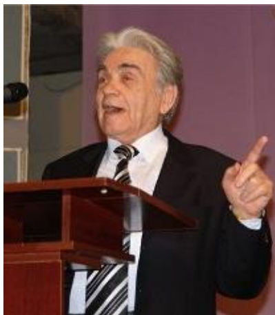
Президент КНК Ю.М. Шанибов