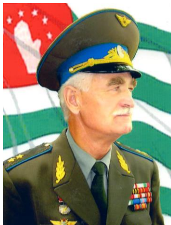
Министр обороны РА С.А. Сосналиев