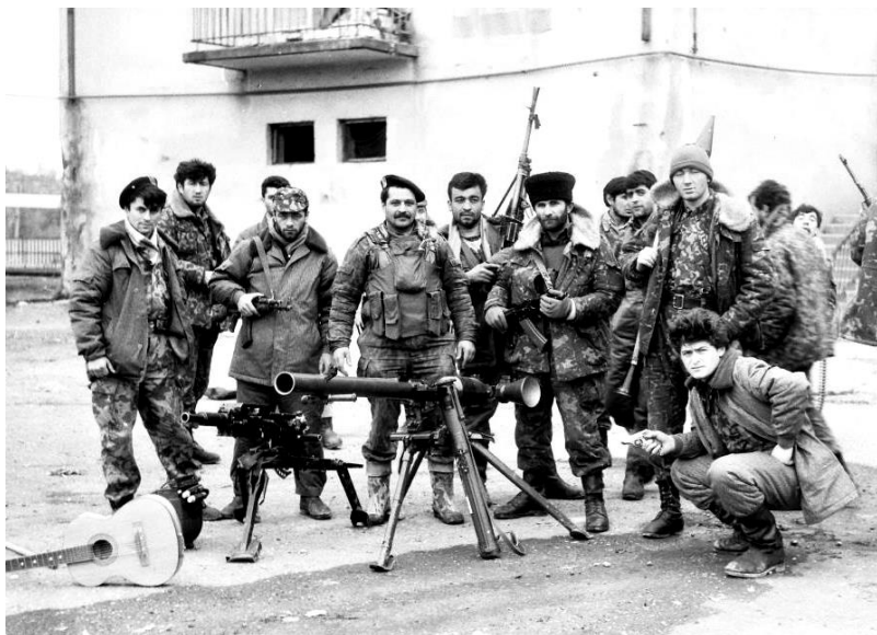
Группа «Кабарда» на Восточном фронте. Зима 1993 г.