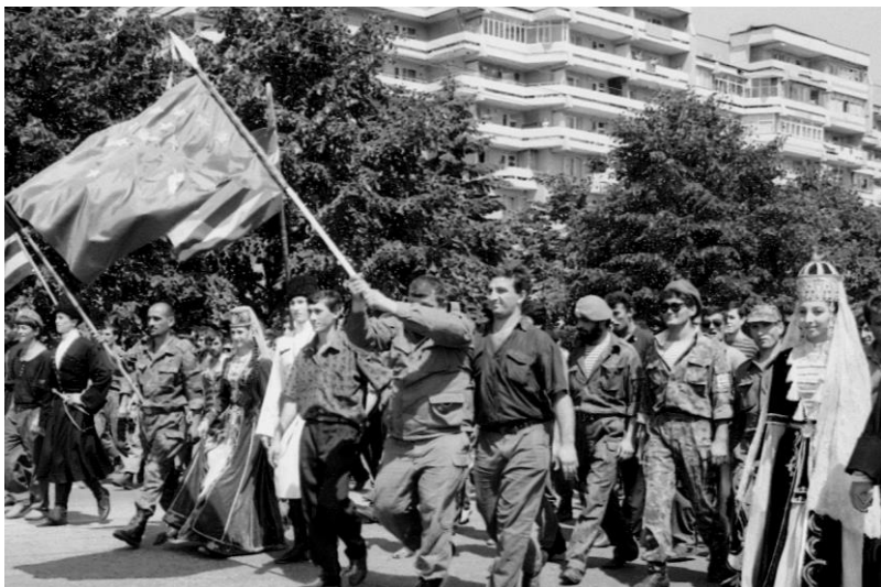
Возвращение кабардинских добровольцев в г. Нальчик. 19 августа 1993 г.