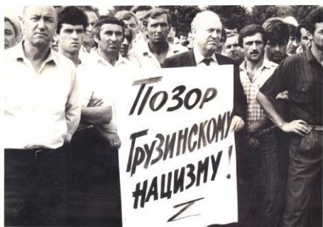
На митинге солидарности с народом Абхазии в г. Нальчике.