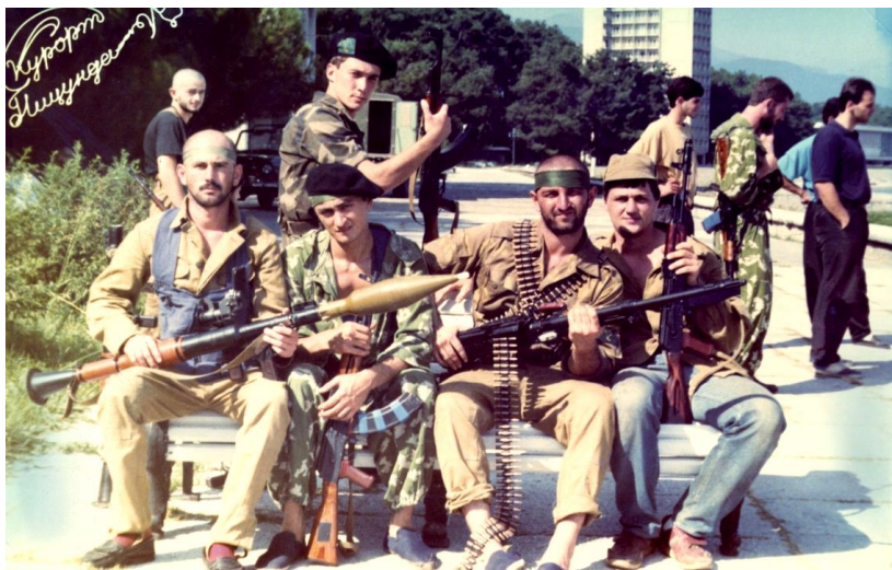
Кабардинские добровольцы в Пизунде. Октябрь 1992 г.