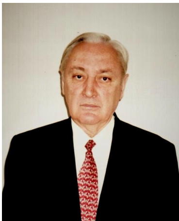
Председатель Верховного Совета КБР Х.М. Кармоков