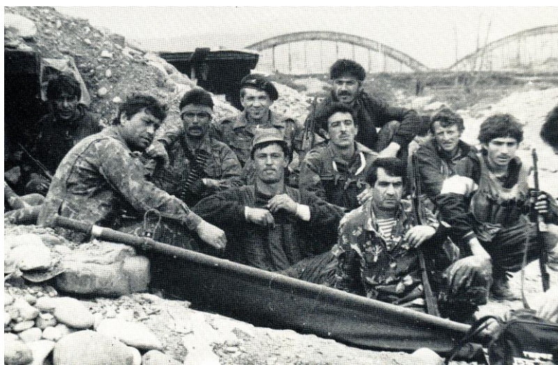
Группа «Кабарда» на Гумистинском фронте. Апрель 1993 г.