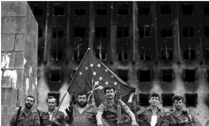
Кабардинские добровольцы возле освобожденного здания Совмина в Сухуме. 27 сентября 1993 г.