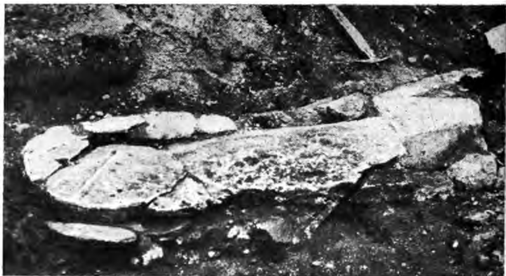
Рис. 3. Саркофаг из Пицунды.

высечены гробницы «антропидной» формы 6 , из музея в Тебессе 7 ) и из Прованса 8 . В некоторых из приведенных примеров головная часть саркофагов имеет полукруглую форму только изнутри.