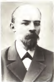
Владимир Ильич Ленин.