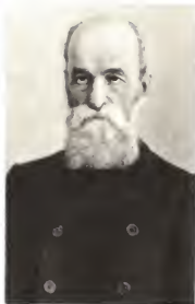
Петр Францевич Лесгафт.