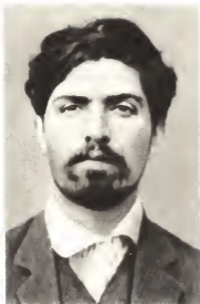
Степан Георгиевич Шаумян.