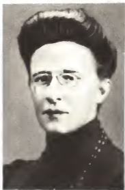
Елена Дмитриевна Стасова.