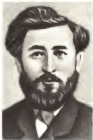
Микаэл Лазаревич Халбандян.