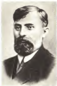
Михаил (Миха) Григорьевич Цхакая.