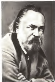
Александр Иванович Герцен.