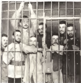
Студенты петербургских высших учебных заведений, арестованные за участие в революционных выступлениях в январе — марте 1902 года.