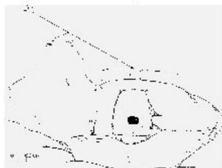
Рис. 3 Дольмен на горе Виноградной

Элементами, указывающими на выполнение некоторыми мегалитами функций «святилища под открытым