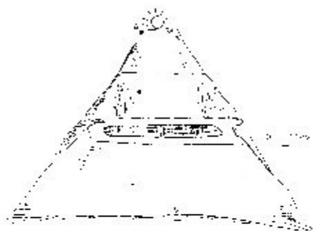
Рис. 2. Дольмен на реке Квасце

небом» служат и нанесённые на них символы и знаки, культового назначения. На дольмене-монолите это круглое углубление диаметром и глубиной 60 см рядом с ровной площадкой в его верхней части.