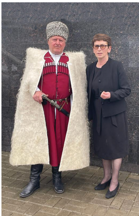
Игор Марыхәбеи Гәыгәыца Цыкырҗаи