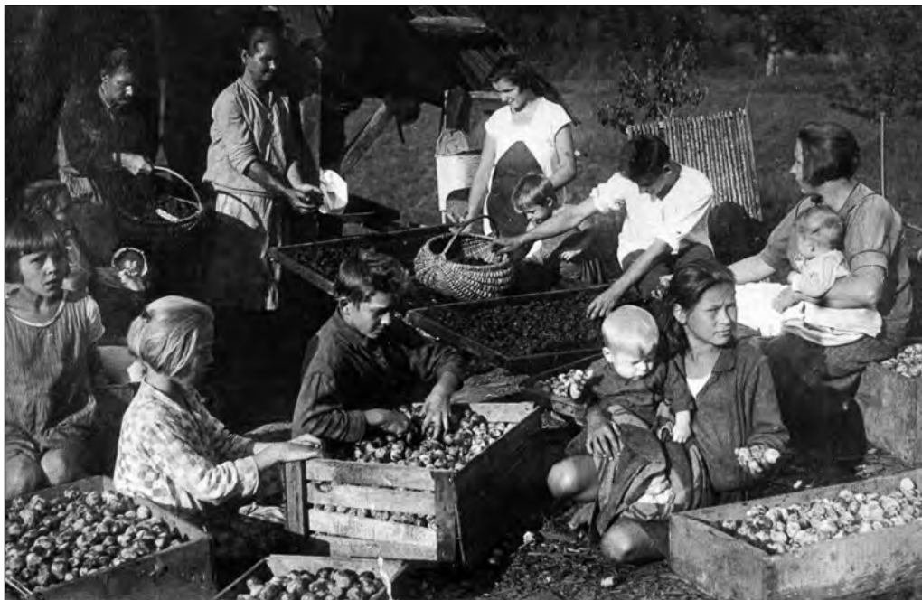
Ploomide sorteerimine ja kuivatamine Eesti-Rohuaias 1930. aastate esimesel poolel.

muud kui andis oma noosa ära, küll oskavad inimeste käest välja pumbata.