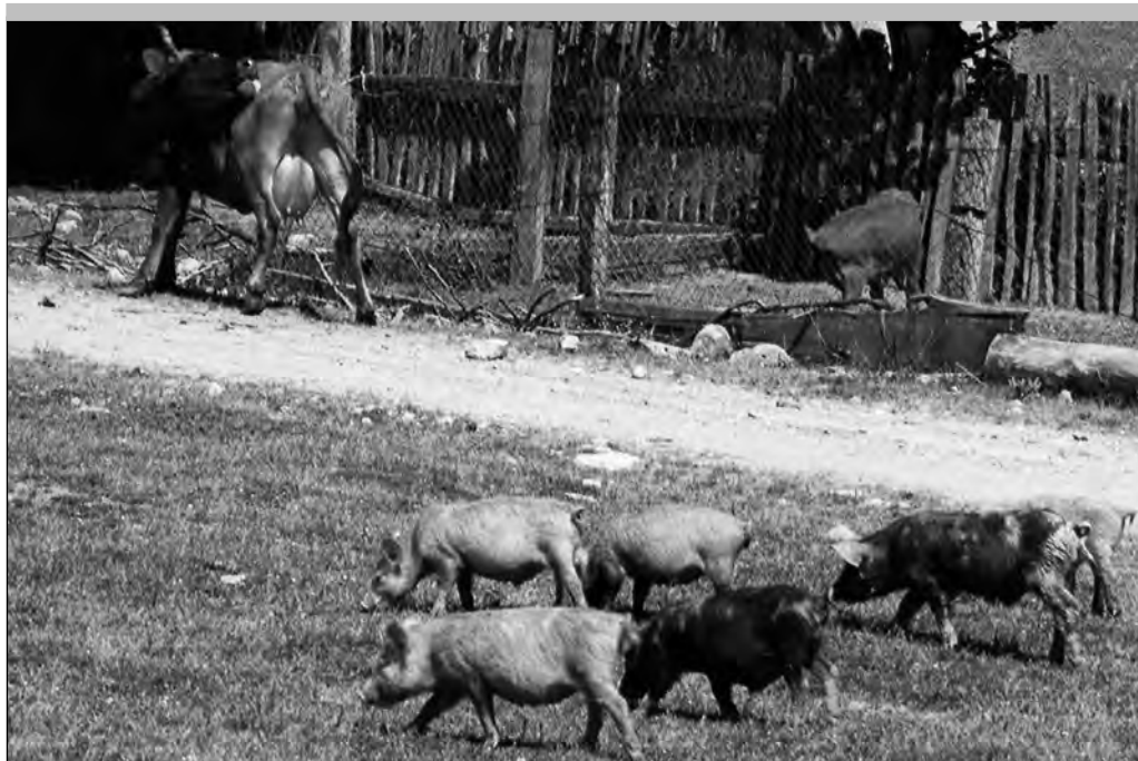
Eesti Rohuaia vaade 1996.