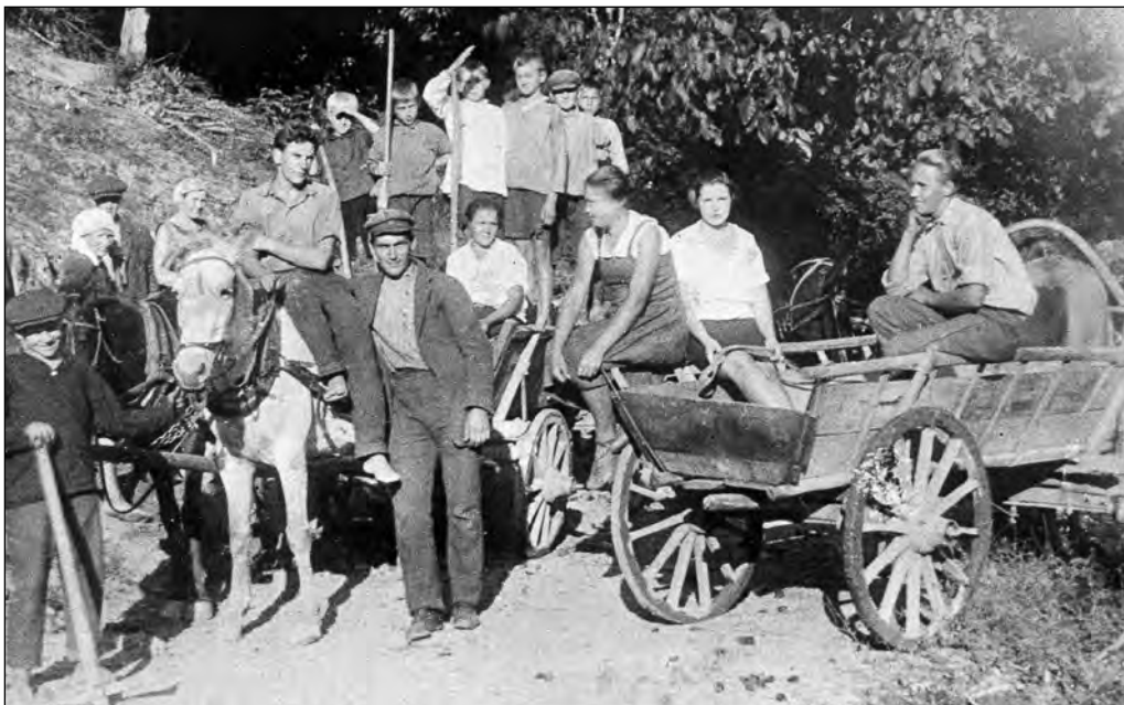
Tee-ehitamise subbotnik , 1930. aastate keskpaik Eesti-Rohuaias.

aruanne ja ka ümbervalimised. Eila oli jälle möödaläind aasta saavutuste ja vigade ülesmärkimine. Mind valiti tulevase pravlenja liikmeks. Küll on see asi ära tüüdand, ligi paar aastat olen prigadiriks olnud, ajab see asi vist küll peast ogaraks. Tunnen kohe et pea enam midagi kinni ei võta. On see elu kole kent-sakas ja veider. Kõiksugu kontrakterimised ja nõudmised, piitsutasse sind igast kandist. On kuulda, et tahetasse viimased lehmad ära võtta, no siis on küll nälj varaks. 5