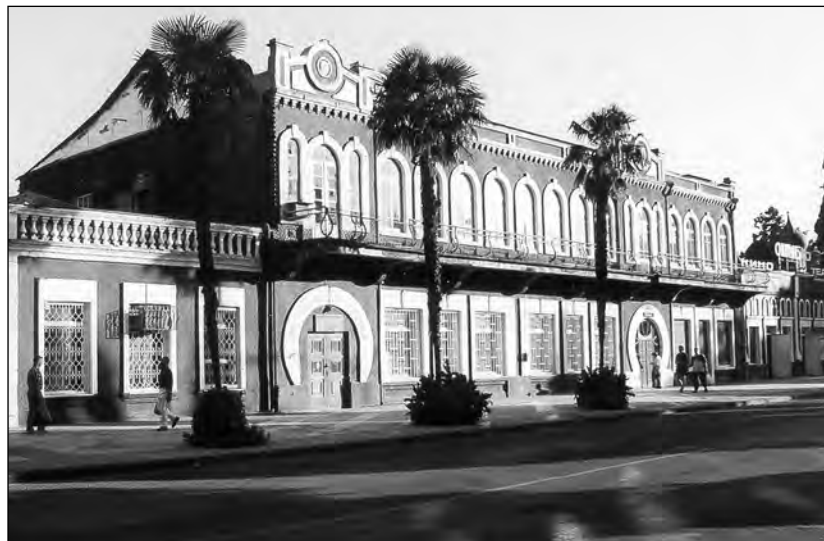
Endine postimaja Adleris. Foto: M. Mikkor, 2000

öhtu antasse siis aru kellegi süüdlaselle, mis mõistetasse. 27 Küll oli hea, et mina selle korra kuskil ametis ei olnud. 28 Mu elu on endine, elame vana moodi, oleme kaunis tervise juures selle korra. Alma papa ja mamma läksid Adleri ametisse, nii kõik see elu läheb. Nüüd on kartuli valitsemine, maad on hunnikuid täis.