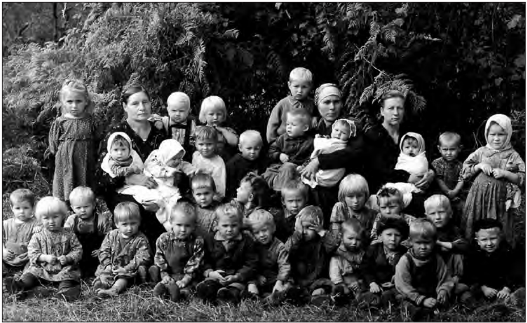
Kolhoosi lasteaid 1940. aastate alguses. ERM, fk. 2112: 430

4. oktoobril. Olen juba teist päeva haige, ei ole pravlenja ligigi läind. Saab näha, mis sellest asast tuleb, kui nüüd lahti saan, siis enne paari aastat ei hakka ühegi vastutava ametisse.