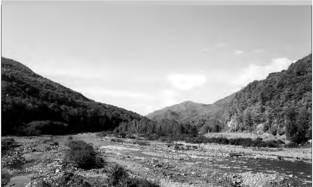
Mžõmta jõgi Eesti-Rohuaias. Foto: Marika Mikkor, 2000