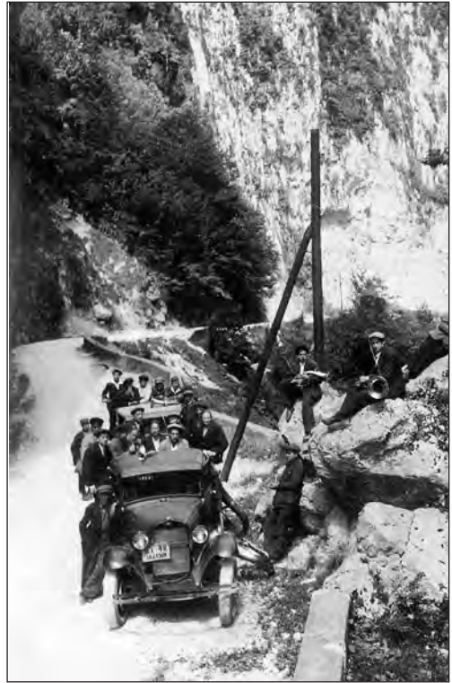
Salme või Sulevi pasunakoor teel koju pärast külaskäiku Eesti-Rohuaeda. 1930. aastad.

8. novembril. Jälle need oktoobripühad lähevad varsti mööda, täna on 8. ja ka viima-