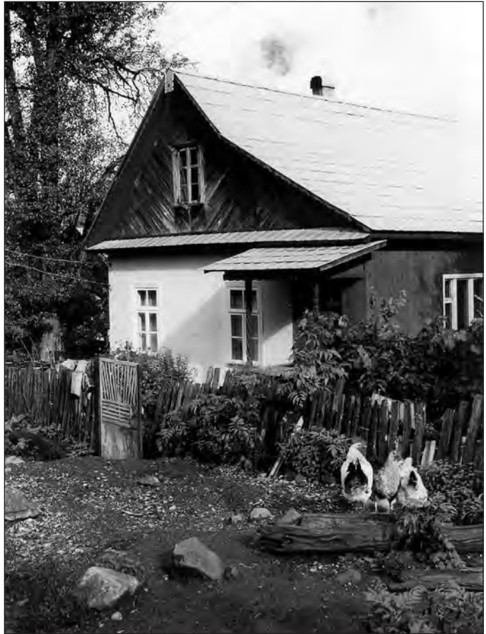
Rootside maja Eesti-Rohuaias. Foto: Marika Mikkor, 1999

7. märtsil. Elu läheb endiselt. Tali hakkab ka juba taganema, vastu päeva mäed on juba paljad. Meil on ikka lund kaunisti, tükati lähed juba. Välist tööd pole saand veel midagi teha.