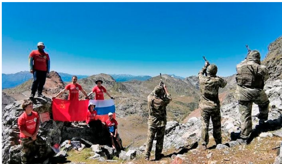
Салют в память о павших защитниках Кавказа