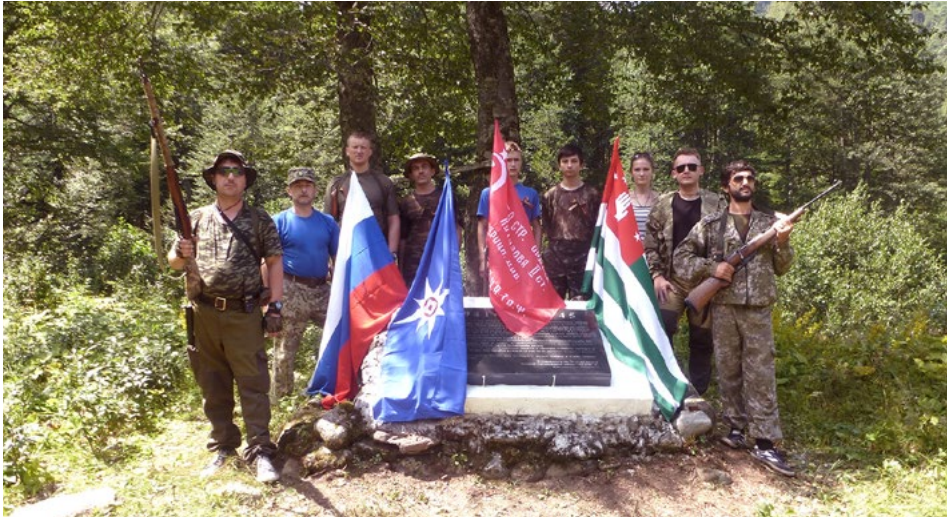
У мемориальной плиты, установленной в память о бойцах и командирах группы войск Марухского направления. Долина р. Южный Марух, август 2016 г.