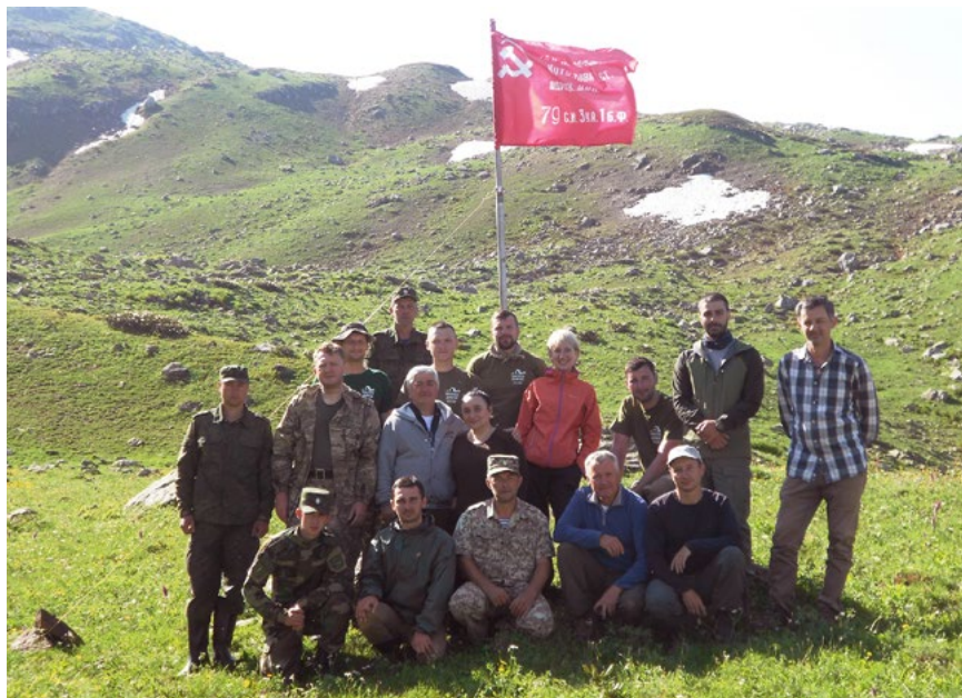
Участники Международной военно-исторической поисковой экспедиции «Санчара. Высокогорный фронт-2017»