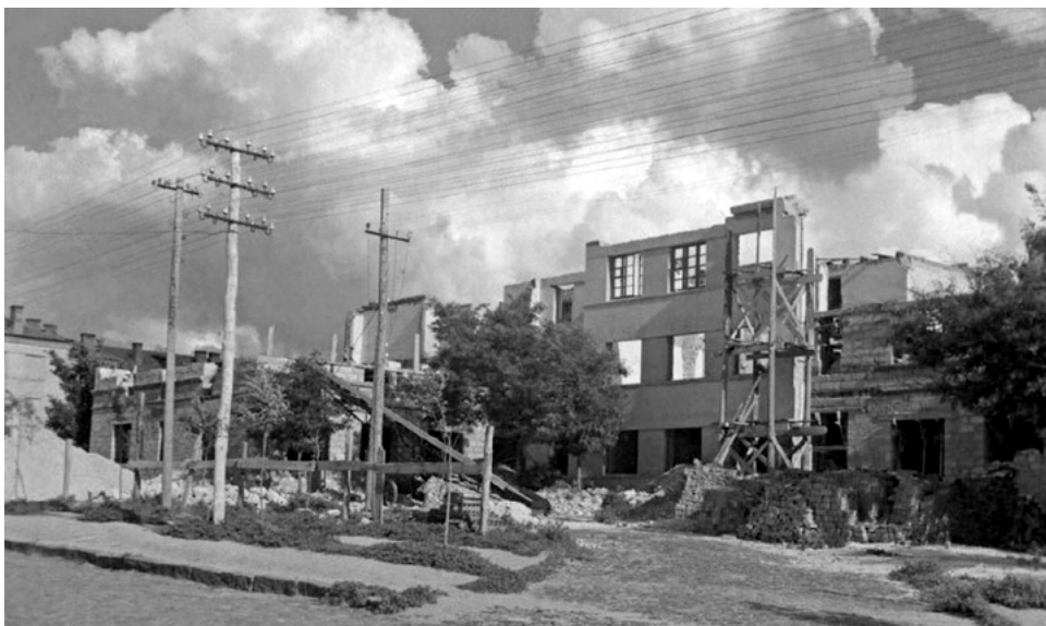
Тирасполь, ул. 25 октября. Так город выглядел в 1944 г. после освобождения от оккупации