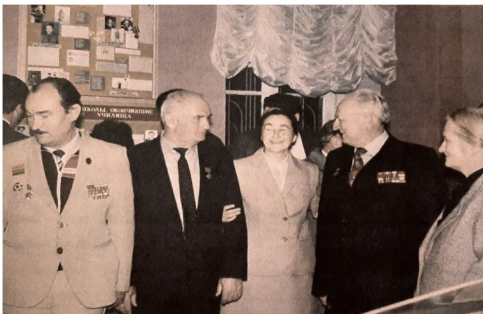
Открытие Музея Боевой и Трудовой Славы Гагрской средней школы № 2. Гагра, 3 ноября 1988 г.