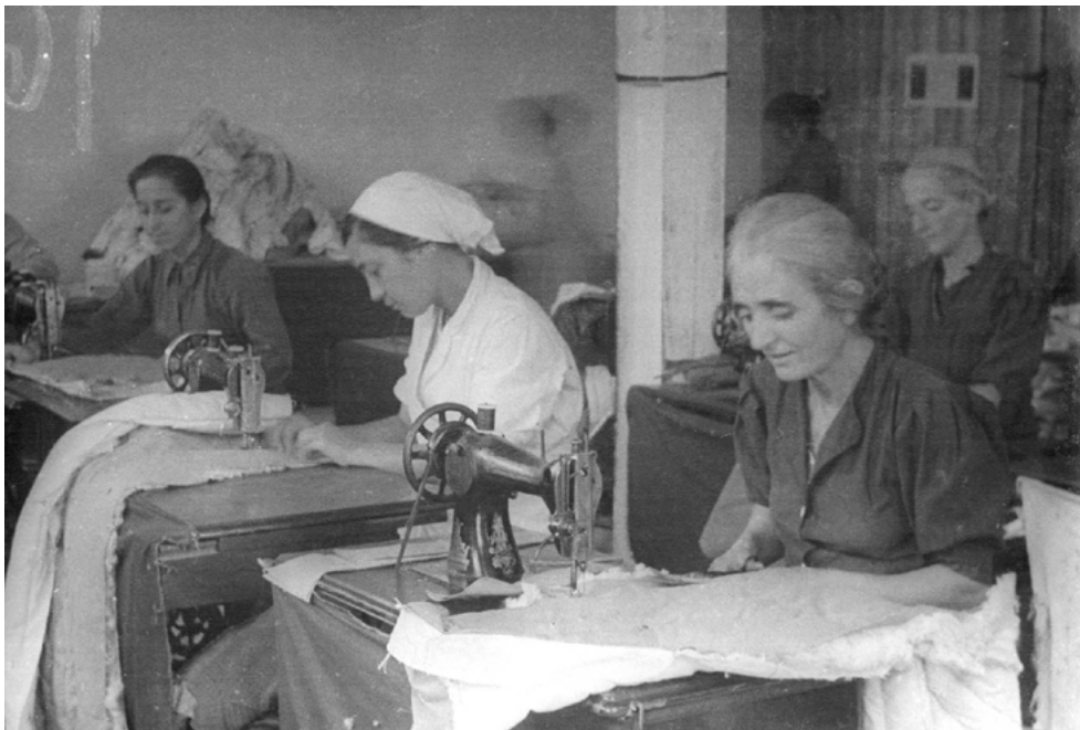
Швейные мастерские Абхазии работали день и ночь