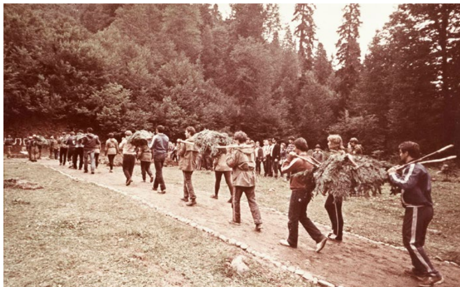
Участники строительства мемориального комплекса «Оборонная тропа» вносят обнаруженные ими на пер. Марух останки советских воинов для предания земле. Осень 1985 г.