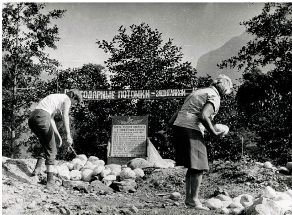
Бойцы поискового отряда «Долг» (г. Москва) благоустраивают территорию у памятного знака, посвященного советским воинам, сражавшимся на Клухорском операционном направлении