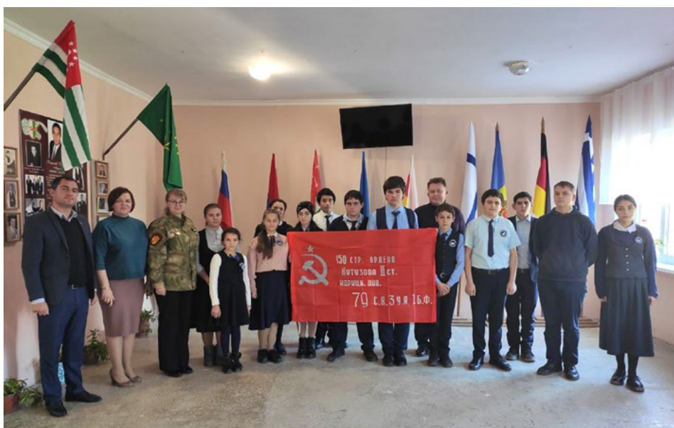
После урока мужества для учащихся Гячрыпшской средней школы, посвященного целям и задачам поискового движения. 5 декабря 2021 г.