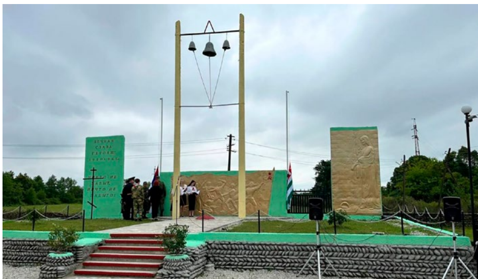
Мемориал погибшим в Великой Отечественной войне 1941-45 гг. в с. Вида-Баргяп Галского района