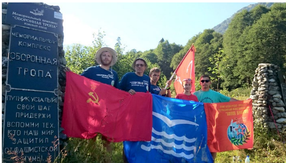
Мемориальный комплекс «Оборонная тропа». Южный вход