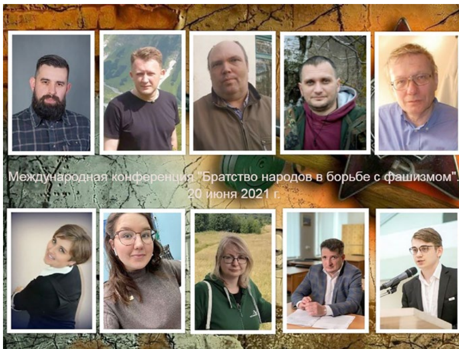
Участники I Международной научно-практической конференции «Братство народов в борьбе с фашизмом»