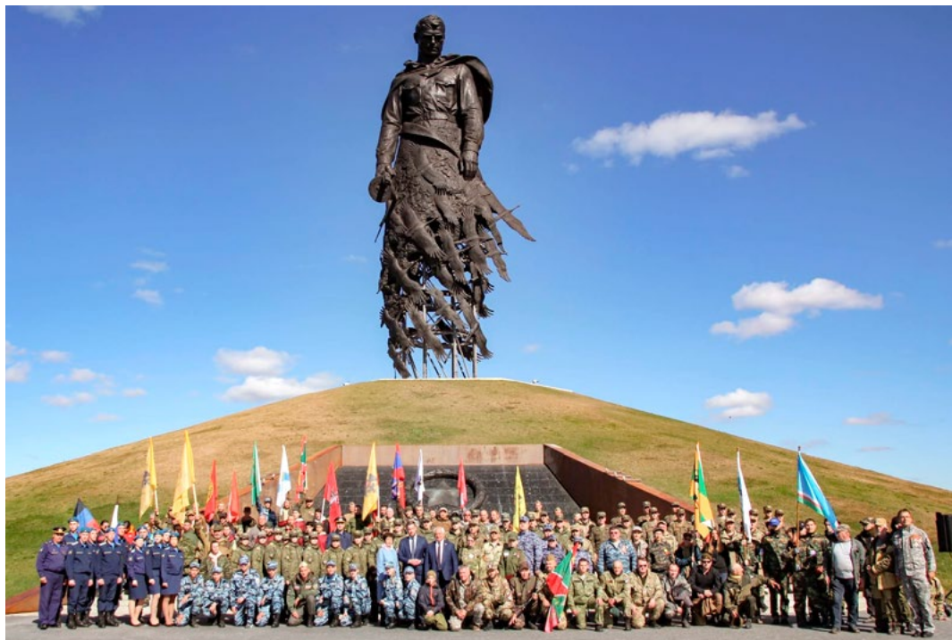
Участники Международной военно-исторической поисковой экспедиции «Ржев. Калининский фронт-2022». На мероприятии была представлена и Абхазия