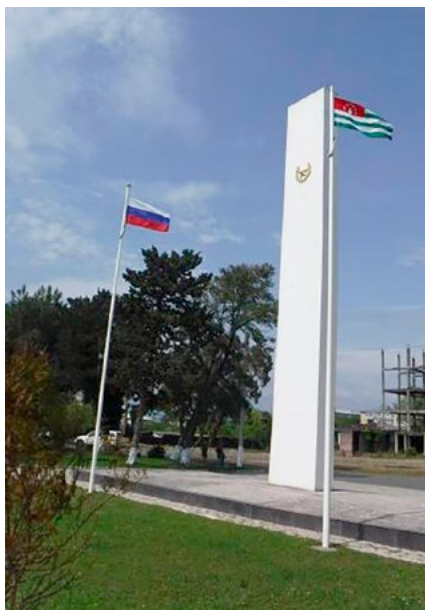
Мемориал советским воинам в г. Очамчыра