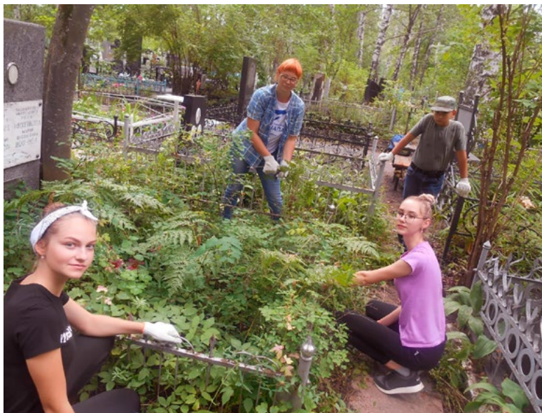
Перед началом уборки могил советских воинов. Август 2020 г.