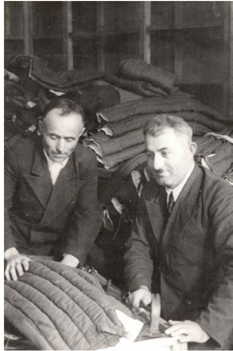
Упаковка зимней одежды для солдат РККА