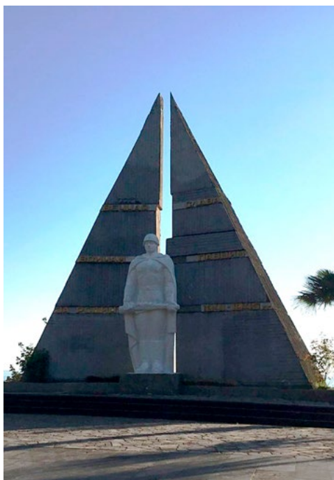
Памятник павшим в 1941–1945 гг. в г. Гагра