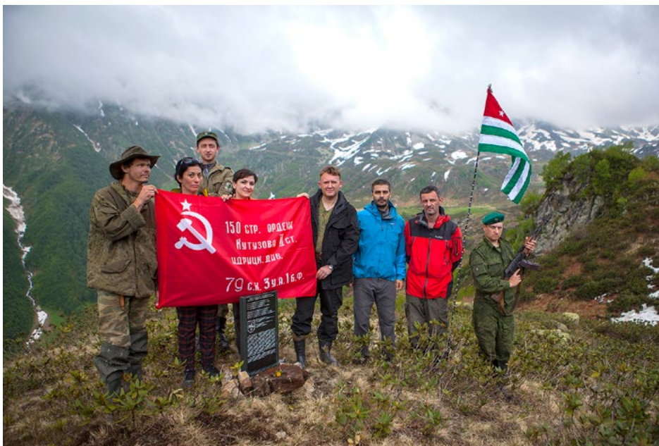
Установка памятного знака, посвященного защитникам перевалов Санчарского направления. 22 июня 2015 г.