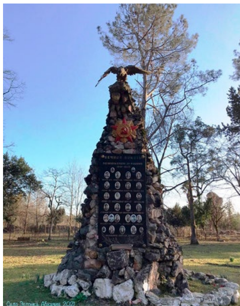
Памятник павшим односельчанам в с. Допукыт