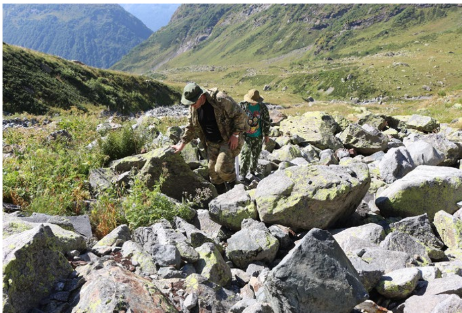
Международная военно-историческая поисковая экспедиция «Марух. Высокогорный фронт-2020». Условия работы в горах значительно отличаются от равнинных в силу природных факторов