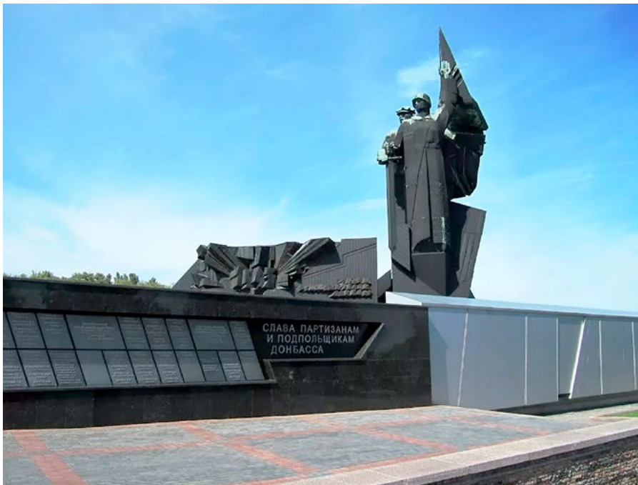
Фрагмент монумента «Твоим освободителям, Донбасс» (г. Донецк)