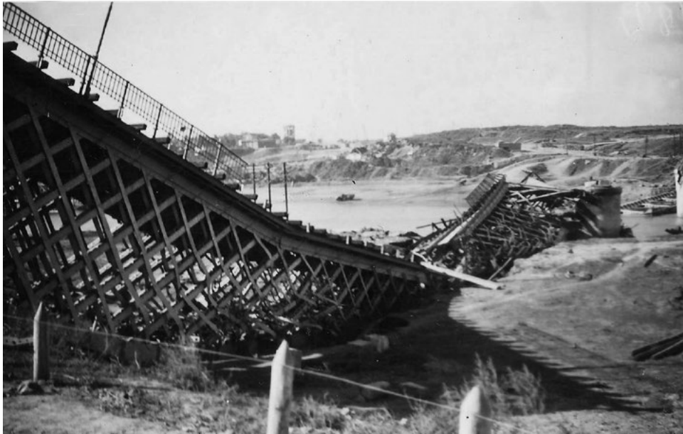
Взорванный мост в районе г. Бендеры. Лето 1942 г.