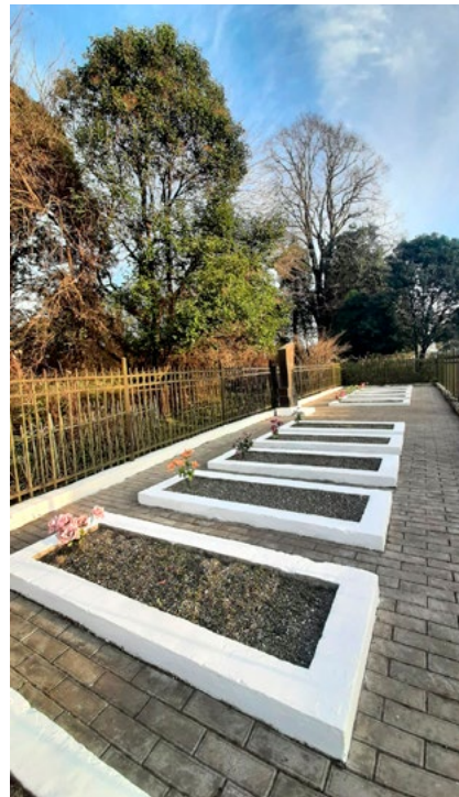
Облагораживание захоронения 11 советских воинов в пос. Дранда. «До» и «после»