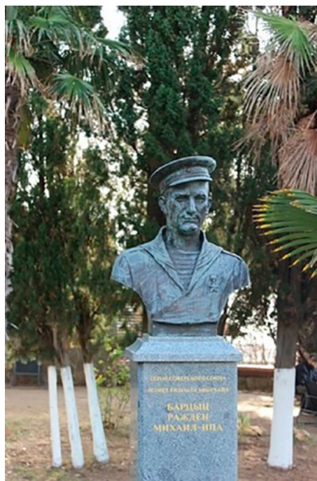
Памятник Герою Советского Союза Р.М. Барциц