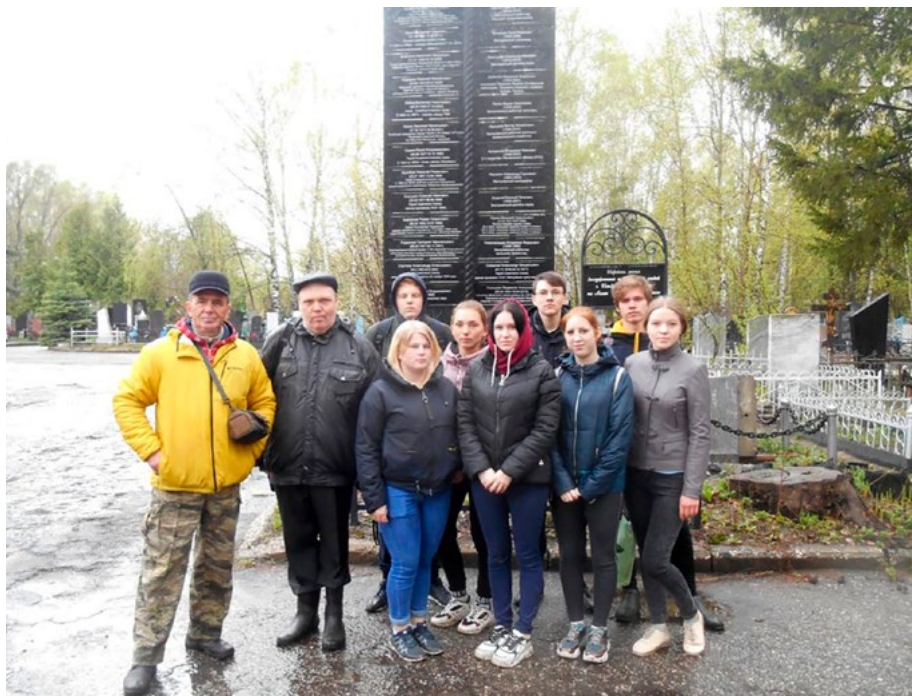
После облагораживания могил защитников Отечества. Май 2021 г.