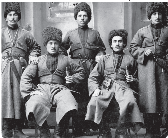
всадники Абхазской сотни

Абхазов воевало в Кавказской конной дивизии до 500 человек. В основном, это 4-я сотня Черкесского полка. Но были абхазские всадники и в Ингушском, Кабардинском, Татарском полках. Очень много их сражалось и на других фронтах. Часть из абхазских всадников впоследствии участвовала в белом движении. Особенно много было абхазов у А. Деникина. К сожалению, еще не все имена героев Пер-