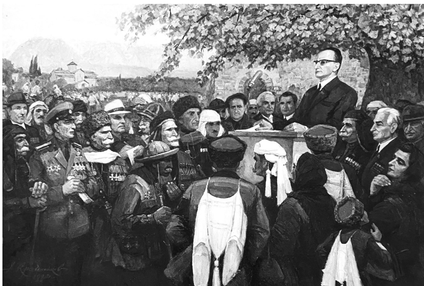
Гъ. Зизариа лхаа реизарағы

гъы ихағыртәашьала аңыз-ртәа иалху абақа изықатцара даңсаны дықан. Ахацәа рхы-рғы ианагы апагыара ықәуп, иаразнак ргәы еибакуюит, рйцартцәтқәы иқыюуп, амала, мыцхәы ицәажәазом, иццакзом» 1 . Идыруп, ари ахәахьа зызку Гъ. Габечиа ифызцәа ацсуа хацәа-рыцарцәа шракәу!