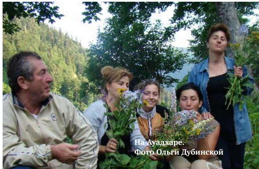
На Ауадхаре.