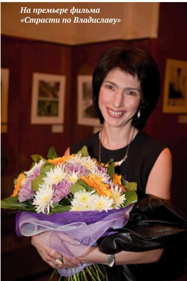
На премьере фильма «Страсти по Владиславу»