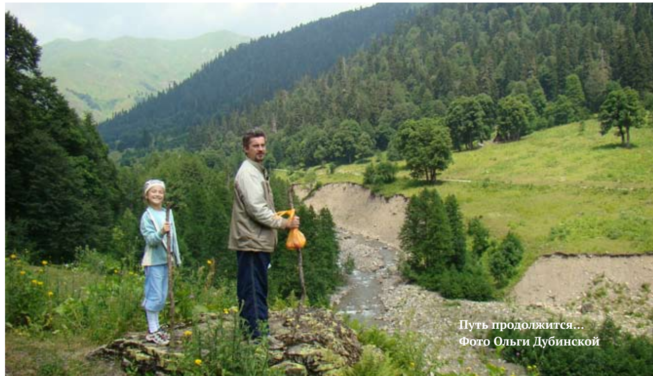
Путь продолжится...

Как раньше, бегу по Тверскому бульвару куда-то. Холод собачий. Листья с деревьев летят. Это Москва.