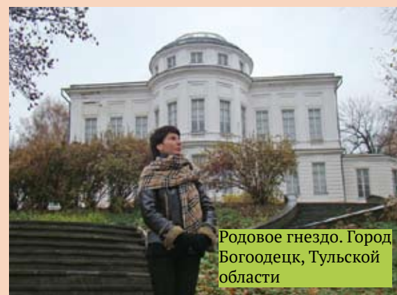
Родовое гнездо. Город Богоодец, Тульской области

«Того разыскивали царские жандармы. Его спрятали в доме моего дедушки – его родственника, в сундук. Моя бабушка положила на сундук моего папу и его сестру, и велела притвориться детям спящими. Когда жандармы обыскивали дом – то детей беспокоить не стали. Так Лазарь Каганович избежал каторги».