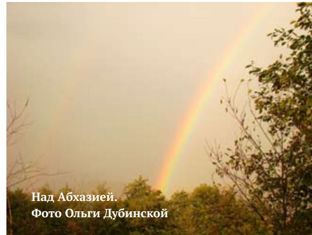
Над Абхазией.