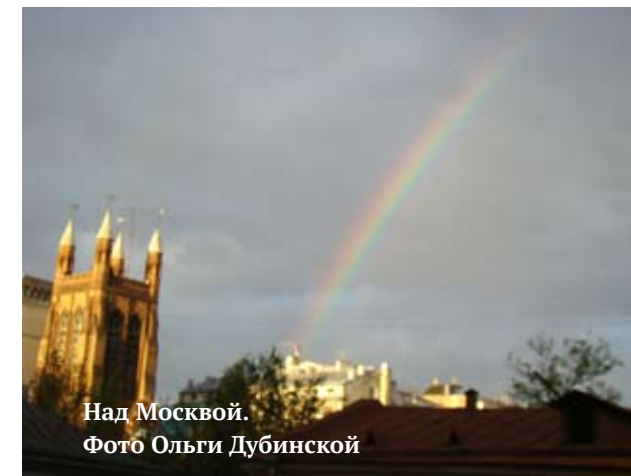
Над Москвой.