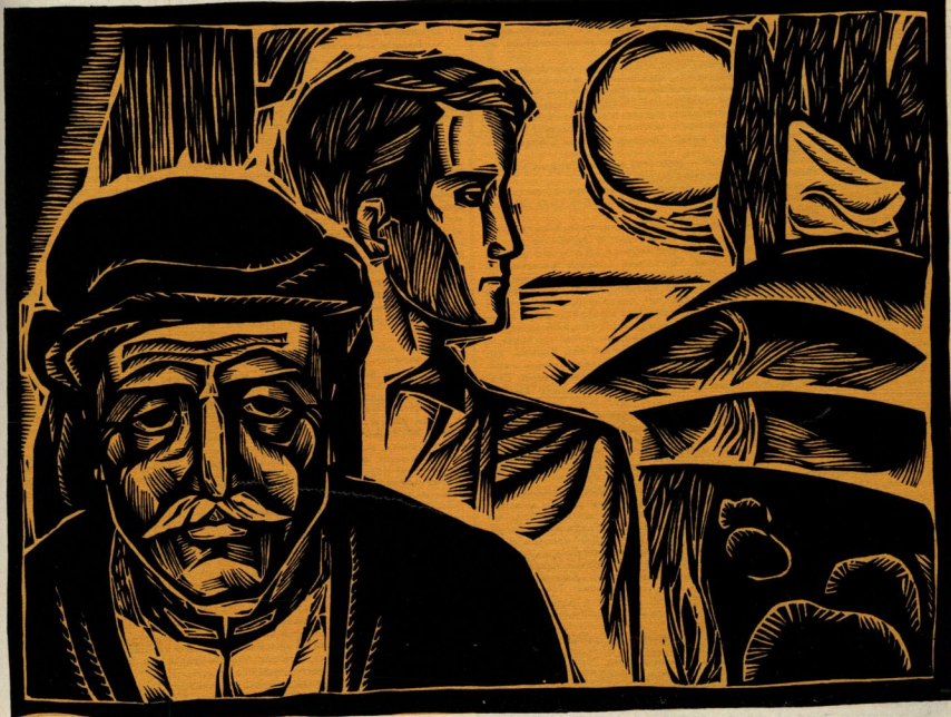
Рисунок Владимира ДЕЛЫ

Сиуарне, конечно, не послушался бы, но гости, подогнанные дождем, уже были на крыльце.