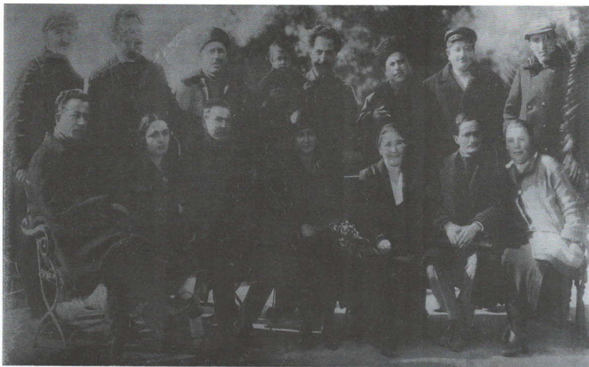
Сухумское фото приблизительно 1926 года, на котором запечатлены Председатель Совнаркома ССР Абхазии Нестор Лакоба (сидит, второй справа), его супруга Сария (сидит, вторая слева), зам. Председателя СНК СССР Серго Орджоникидзе (стоит с ребёнком), секретарь Абхазского обкома КП(б) Грузии Георгий Стуура (сидит, первый слева). Публикуется впервые. Просьба к читателям: сообщить автору брошюры об остальных лицах, изображённых на фото