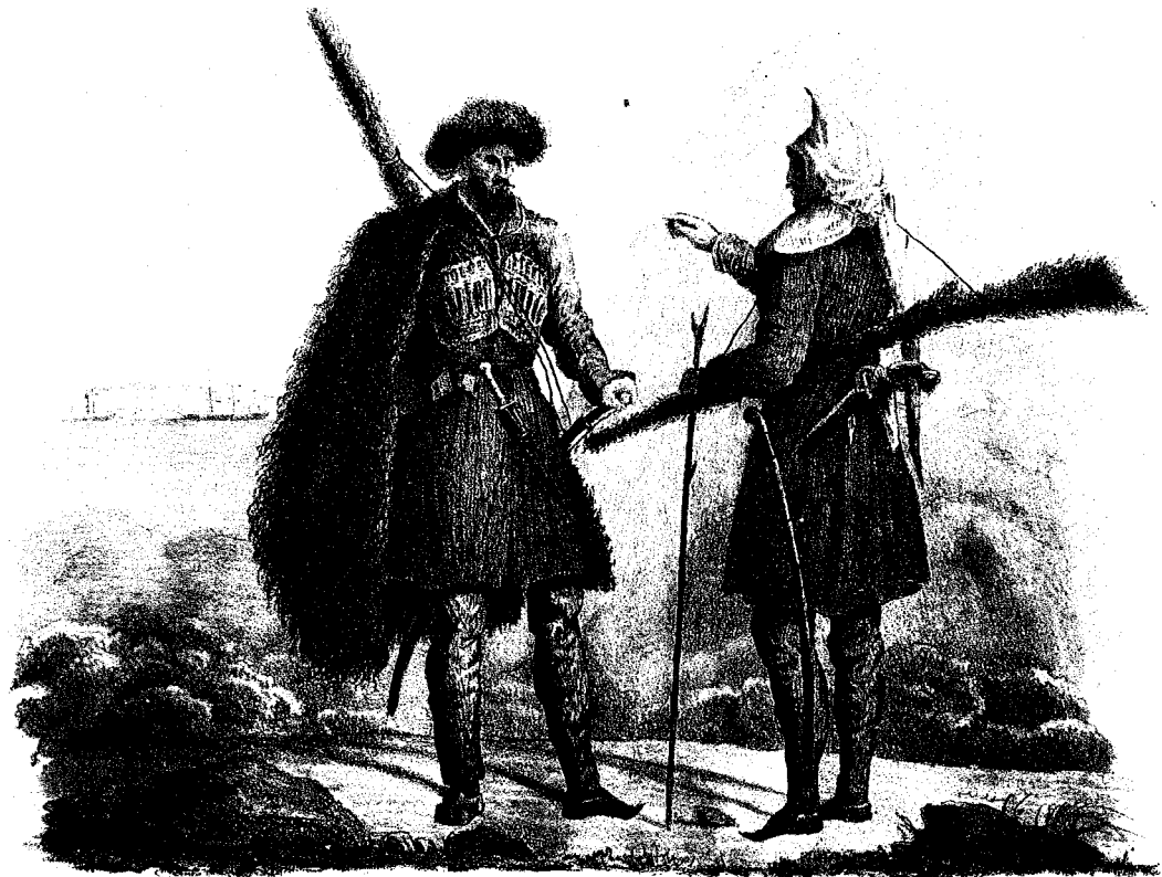
Рис: съ нѣм. Н. Чернецовъ