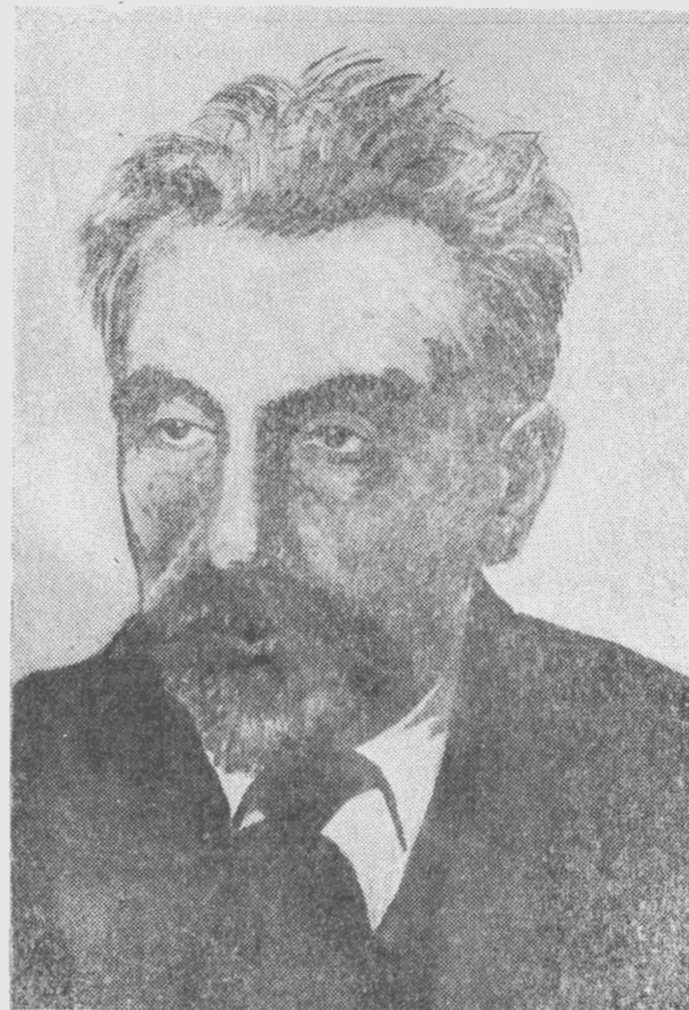
Н. Я. Марр — академик, инициатор создания Академии абхазского языка и литературы, позже преобразованной в Научно-исследовательский институт абхазского языка и литературы.