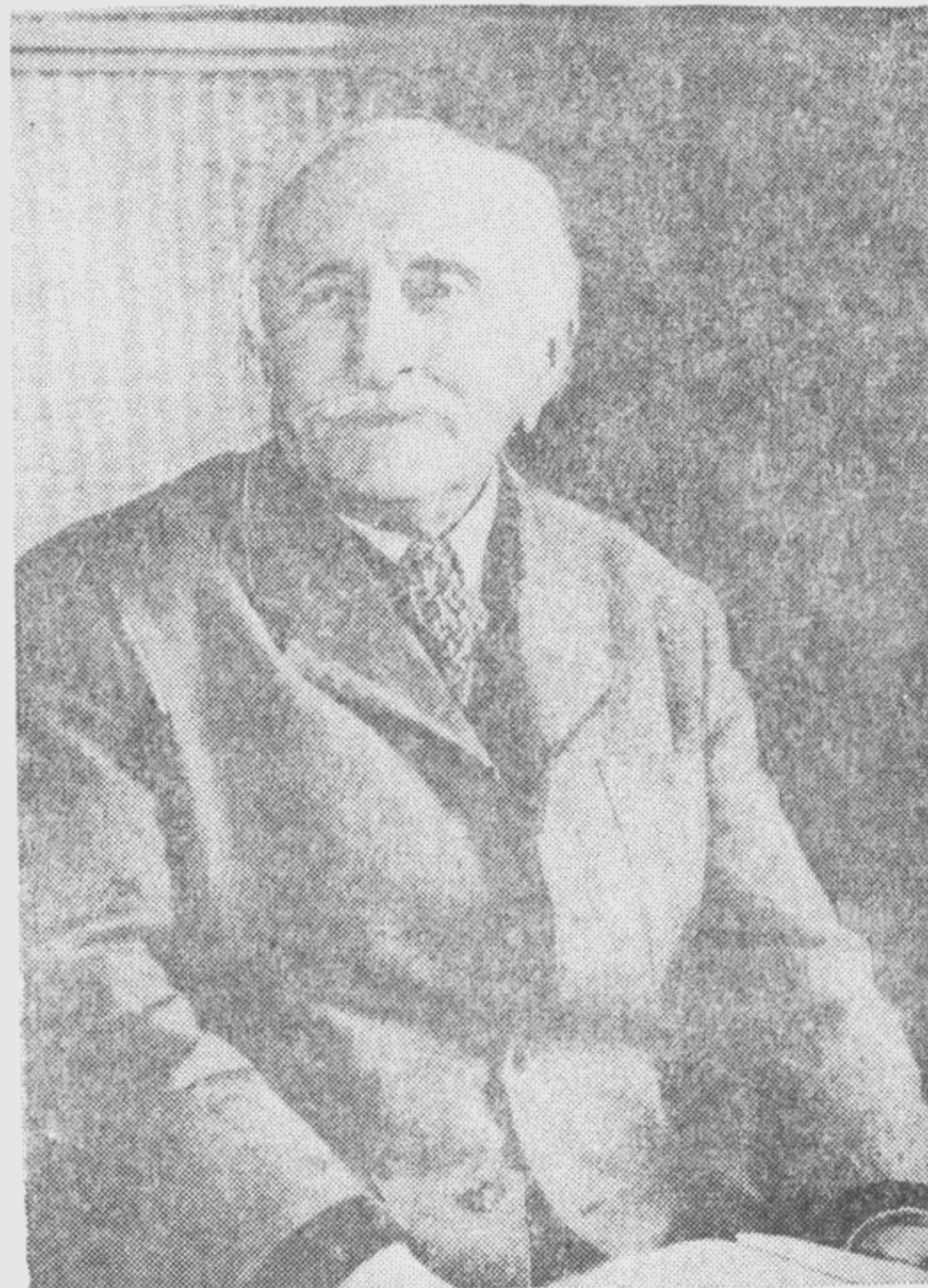
Д. И. Гулиа — народный поэт Абхазии, известный ученый, один из инициаторов создания Абхазского института.