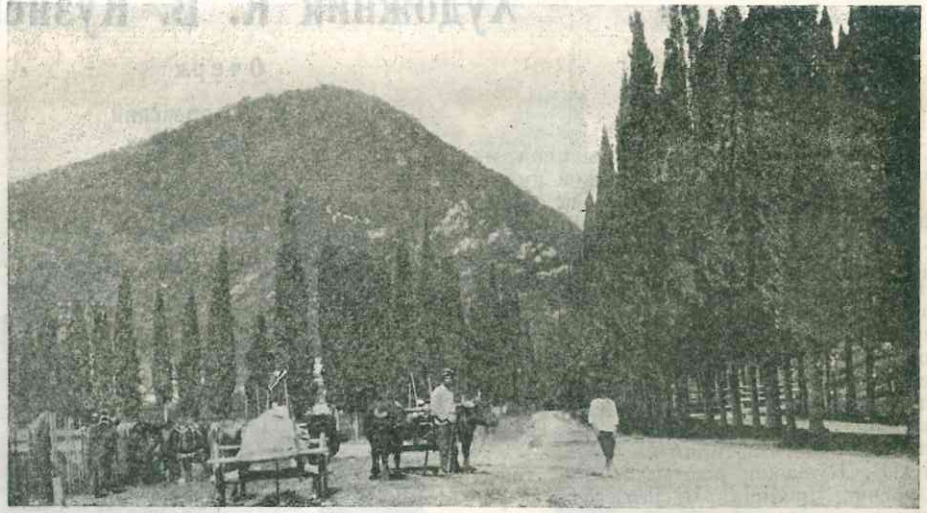
Новый Афон. Иверская гора

Бурливая река Псыртсха приводит в движение мельницу, где перемалывается привозное зерно. На этой же реке мощный водопад дает возможность гидростанции снабжать электротоком всю окрестность. Мельница, электроснабжение и водоснабжение—в руках специалистов, бывших монахов, которым совхоз оказывает полное доверие. Часть оставшихся монахов, сменивших свое длиннополое одеяние на мирское, работает по виноделию, садоводству